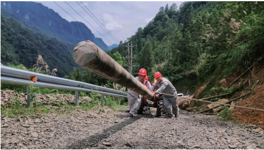
供电所职工在搬运沉重的电杆。