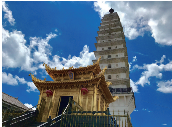
鸡足山金顶楞严塔