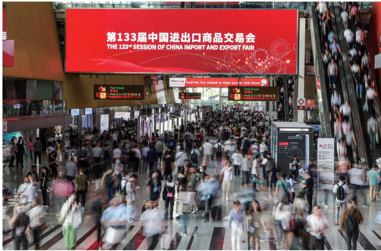
这是4月15日拍摄的第133届广交会现场。