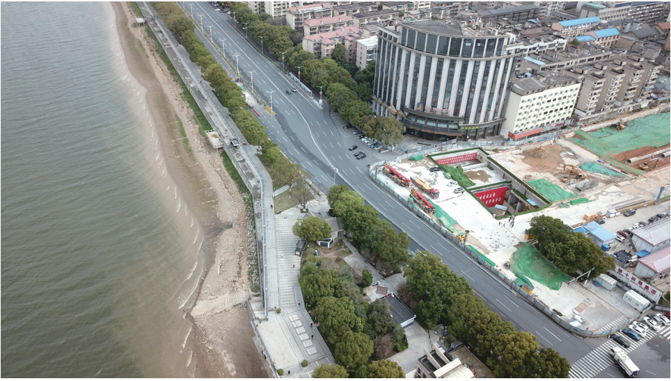
3 月 12 日，从远处俯瞰长沙市湘雅路过江通道右线隧道贯通现场（无人机照片）。

3 月 12 日，由长沙城发集团投资建设、中铁十四局集团承建的长沙市湘雅路过江通道右线隧道贯通，这意味着湖南省在建最大直径的盾构隧道实现双洞贯通。 据悉，长沙市湘雅路过江通道工程的隧道设计为双向六车道，行车时速 50 公里，建成通车后将有效缓解过江通行压力。