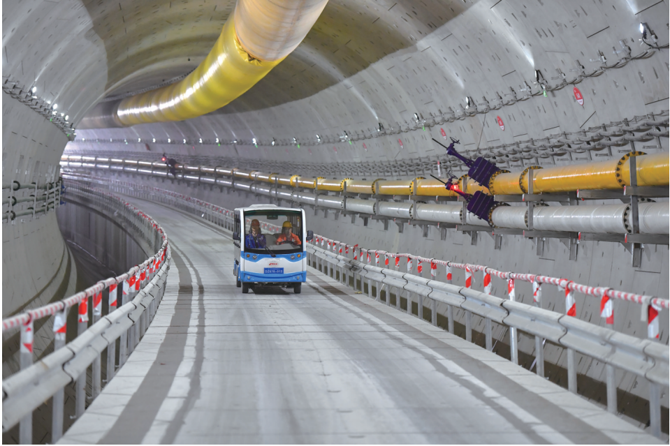
3 月 12 日，中铁十四局的工人在长沙市湘雅路过江通道右线隧道内巡查。