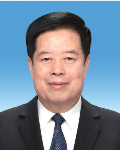
国家监察委员会主任 刘金国

刘金国，男，汉族，1955年4月生，河北昌黎人，1976年12月参加工作，1975年9月加入中国共产党，中央党校大学学历。