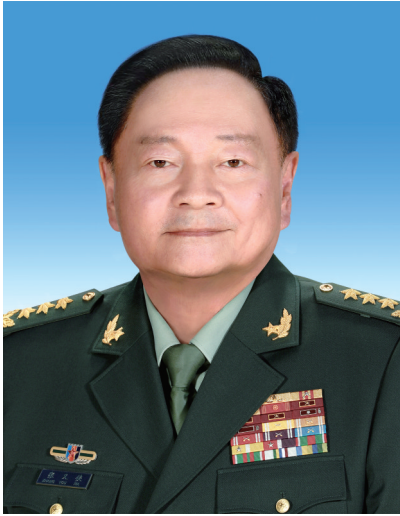
中华人民共和国中央军事委员会副主席 张又侠