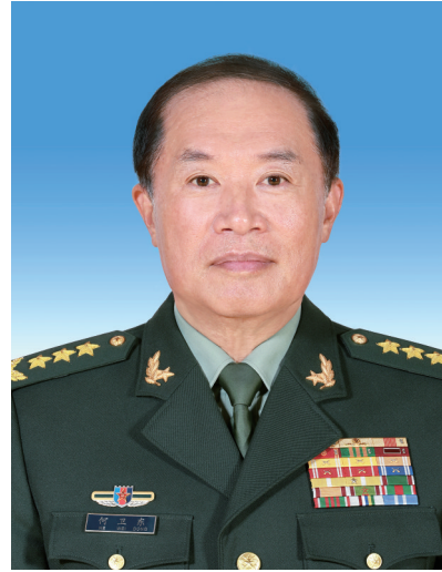
中华人民共和国中央军事委员会副主席 何卫东

张又侠，男，汉族，1950年7月生，陕西渭南人，1968年12月入伍，1969年5月加入中国共产党，军事学院基本系毕业，大专学历。