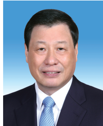
最高人民检察院检察长 应 勇

现任中共二十届中央委员，最高人民法院院长、党组书记、审判委员会委员，首席大法官。