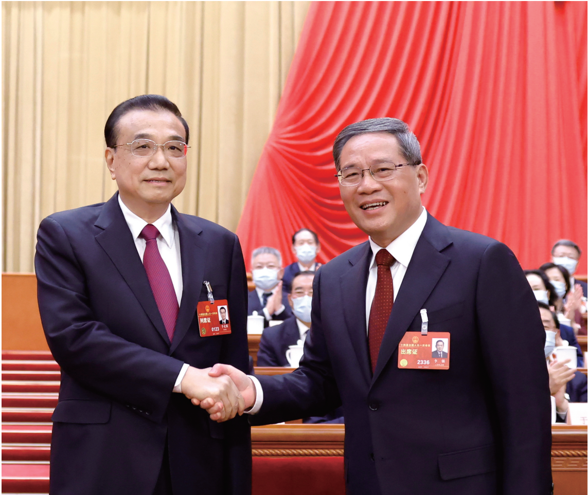
三月十一日，十四届全国人大一次会议在北京人民大会堂举行第四次全体会议，根据国家主席习近平的提名，经过投票表决，决定李强为中华人民共和国国务院总理。这是李强同李克强握手。