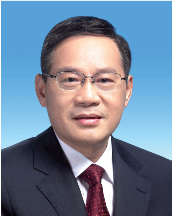
李 国务院总理 强

李强，男，汉族，1959年7月生，浙江瑞安人，1976年7月参加工作，1983年4月加入中国共产党，中央党校研究生学历，高级管理人员工商管理硕士学位。