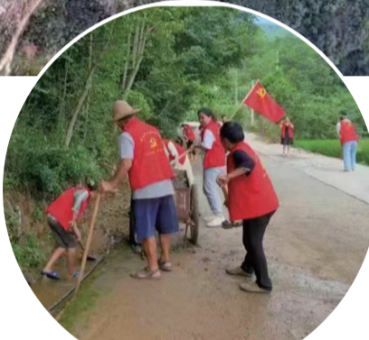
乡村养路工忙碌的身影。

2023年，中央一号文件提出，必须坚持不懈把解决好 三农 问题作为全党工作重中之重，举全党全社会之力全面推进乡村振兴，扎实推进宜