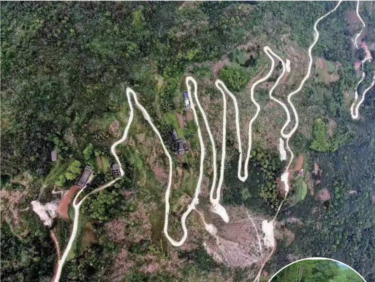
金慈街道亮垭村盘山公路。

慈利县四通八达的农村公路贯穿慈利县全境，针对点多、线长、面广、管养工作复杂的农村公路状况，慈利县交通运输局指导乡村建立农村公路管理养护责任清单，实行 乡镇每月巡查、行业每季考核、全年综合