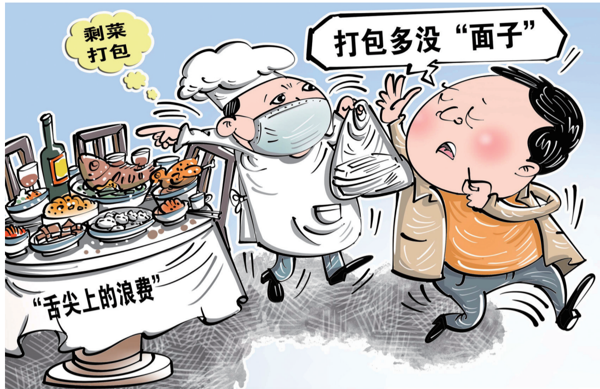
面子 浪费 商海春作

很多消费者说，因为考虑面子，婚宴浪费现象较为普遍。山西一名婚礼操办者任先生坦言：我也很心疼被浪费的粮食。但要是不多