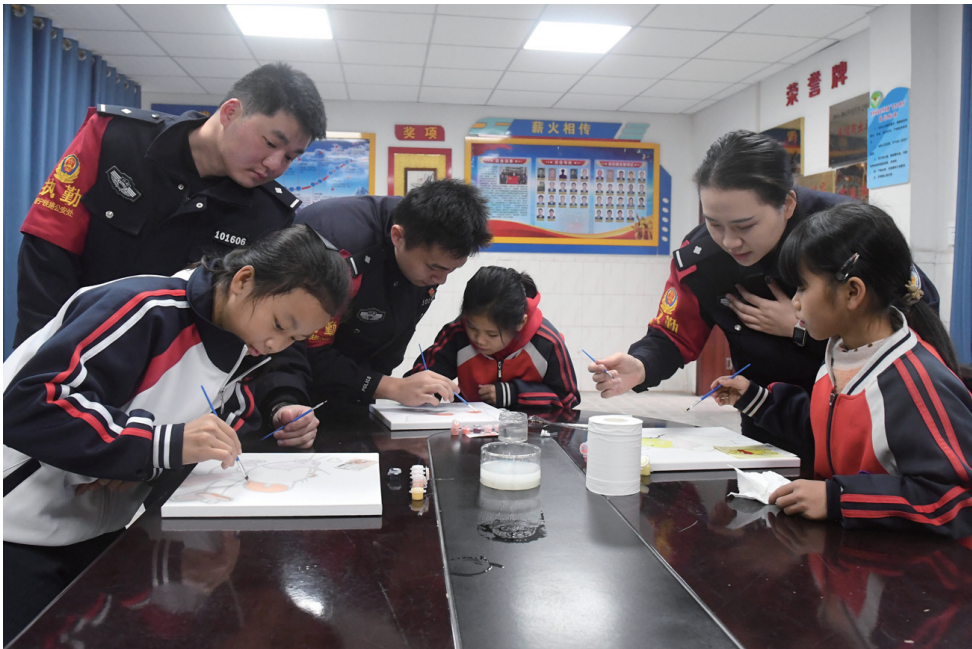
2月5日，在南宁铁路公安局南宁公安处宾阳站派出所，民警与三姐妹一起画画。