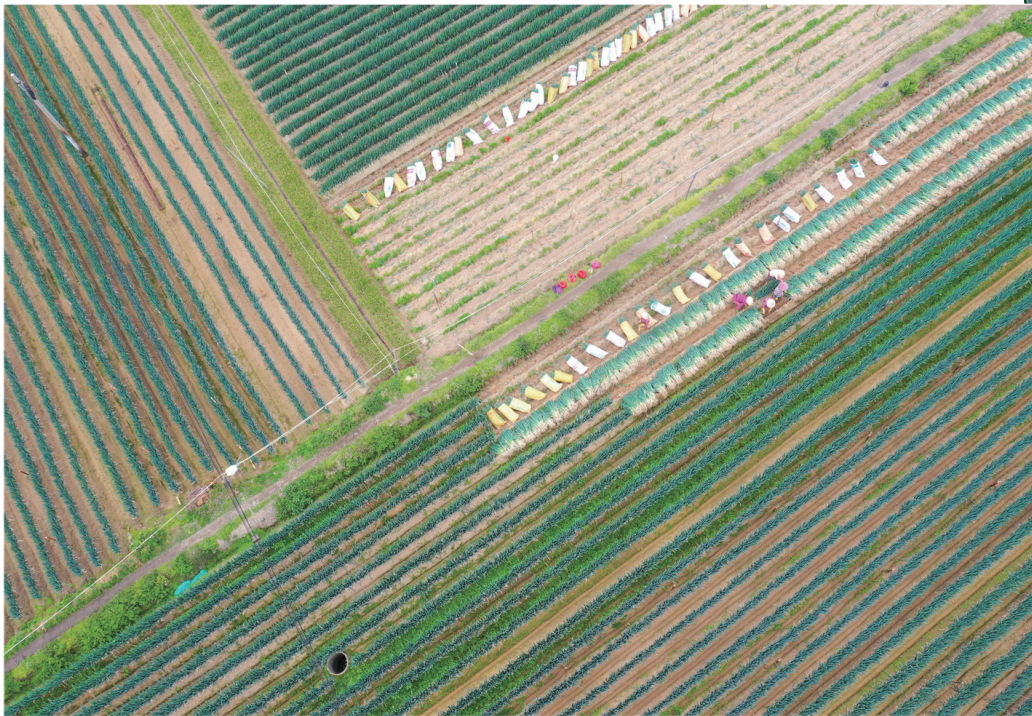
2月4日，村民在漳浦县六鳌镇的一处农田里采收大葱（无人机照片）。