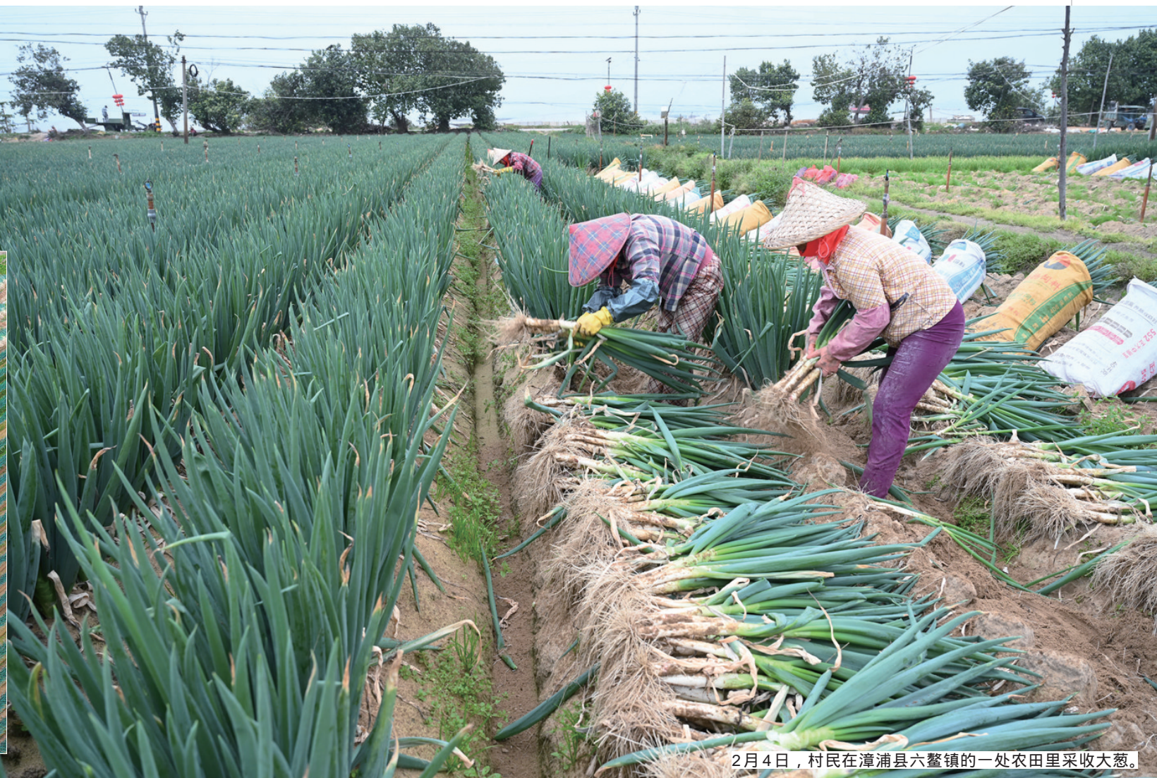
2月4日，村民在漳浦县六鳌镇的一处农田里采收大葱。