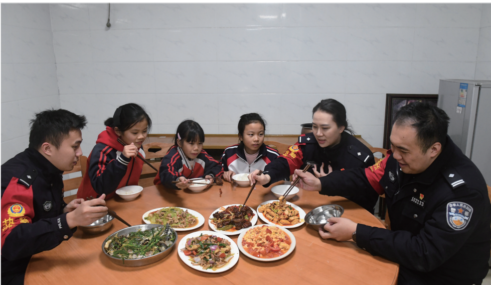
2月5日，南宁铁路公安局南宁公安处宾阳站派出所民警与三姐妹一起吃午饭。