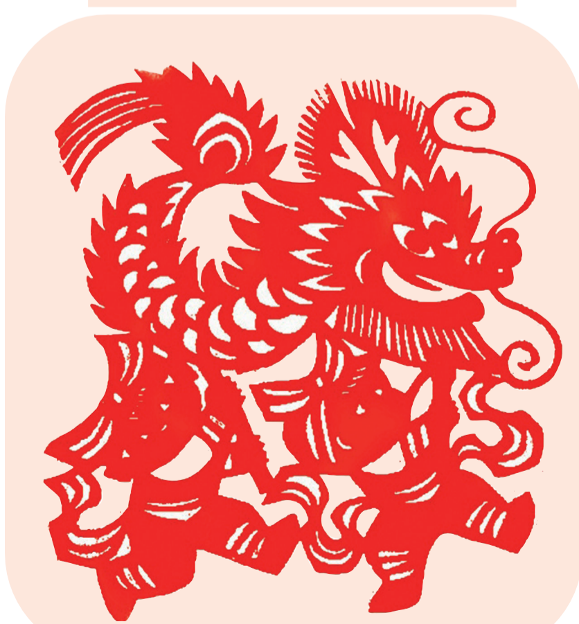
剪纸《舞龙灯》 徐成文 作