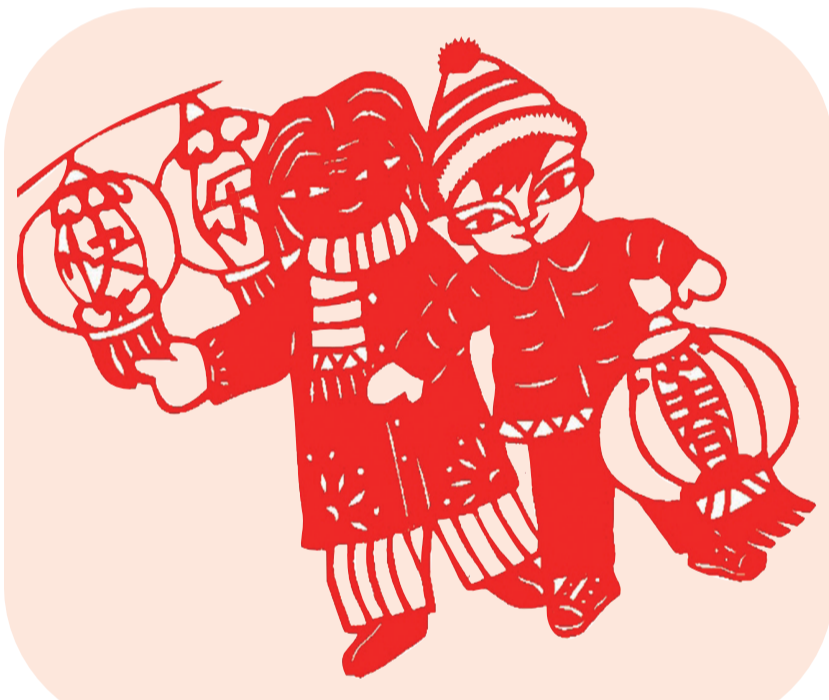
剪纸《我和奶奶看花灯》 徐成文 作