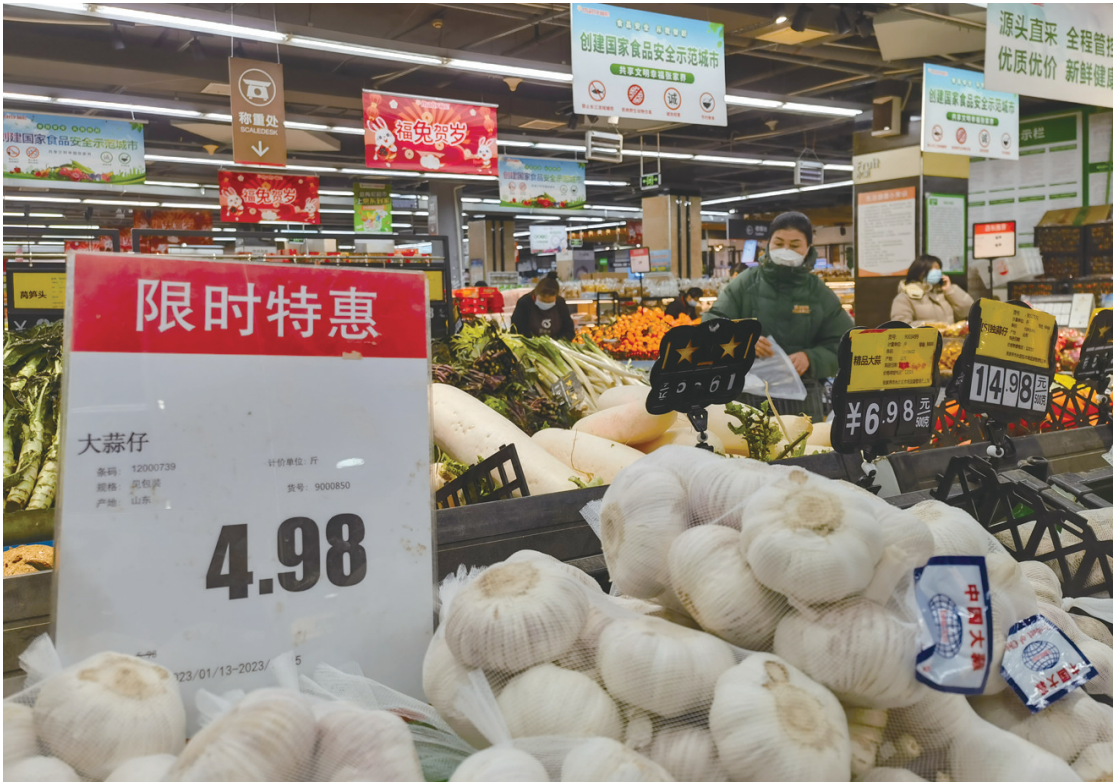
市民在超市购物。

猪肉价格剧烈震荡。2022年，生猪产能稳定恢复，猪肉市场供应充足，但由于饲料价格上涨及养殖户非理性压栏惜售，猪肉价格三季度开始剧烈震荡，但全年仍呈下降态势。2022年猪肉价