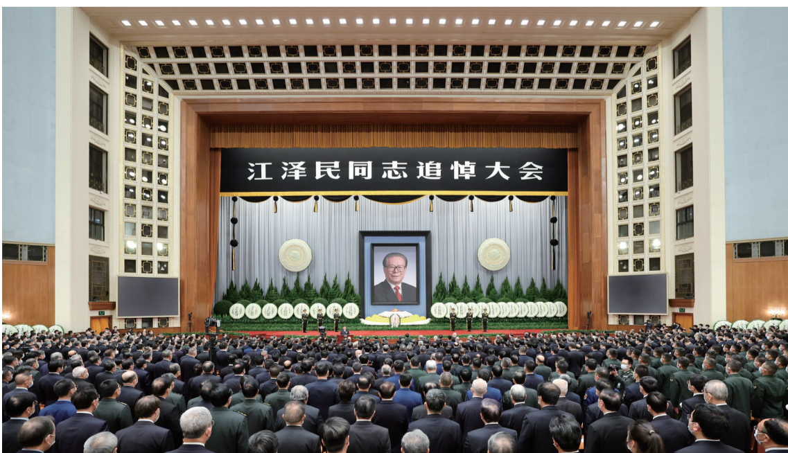
12月6日，中共中央、全国人大常委会、国务院、全国政协、中央军委在北京人民大会堂隆重举行江泽民同志追悼大会。新华社记者 丁海涛 摄