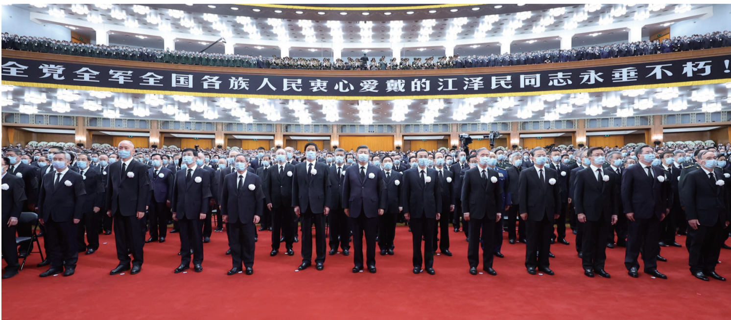
12月6日，中共中央、全国人大常委会、国务院、全国政协、中央军委在北京人民大会堂隆重举行江泽民同志追悼大会。习近平、李克强、栗战书、汪洋、李强、赵乐际、王沪宁、韩正、蔡奇、丁薛祥、李希、王岐山等参加大会。