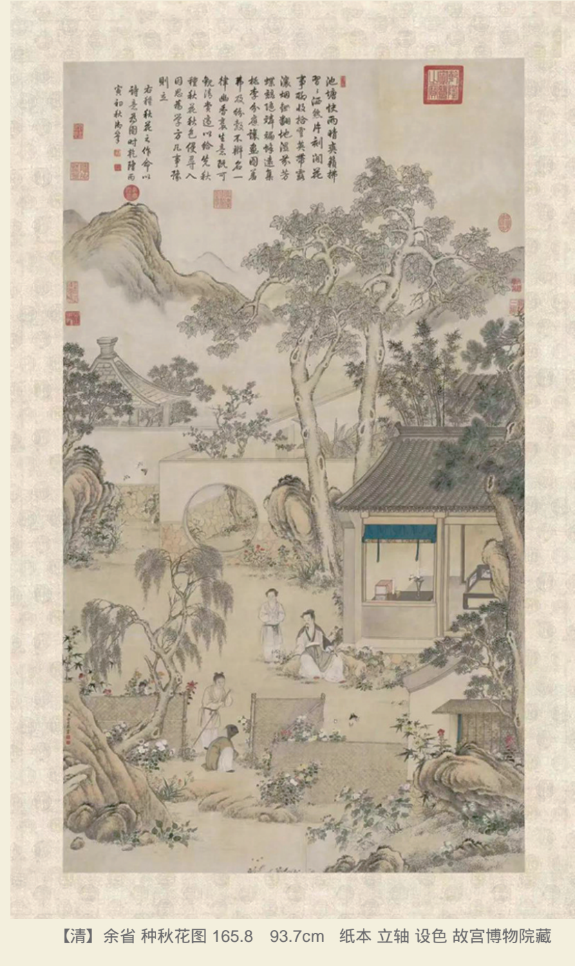
【清】余省 种秋花图 165.8 93.7cm 纸本 立轴 设色 故宫博物院藏