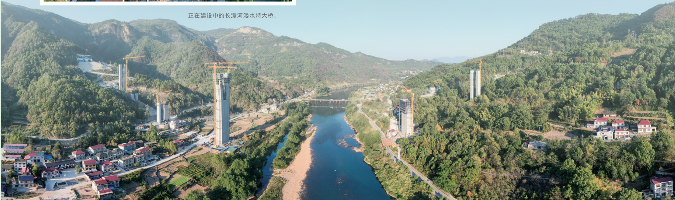
正在建设中的长潭河溇水特大桥。