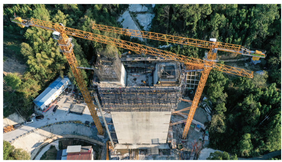
正在建设中的长潭河溇水特大桥。