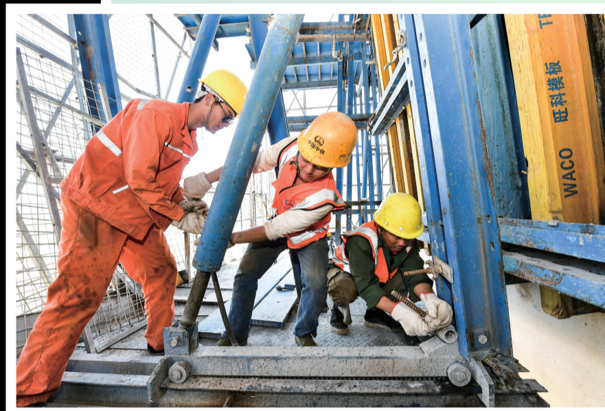
施工人员在距地110多米高的长潭河溇水特大桥8号桥墩工作台上进行施工。