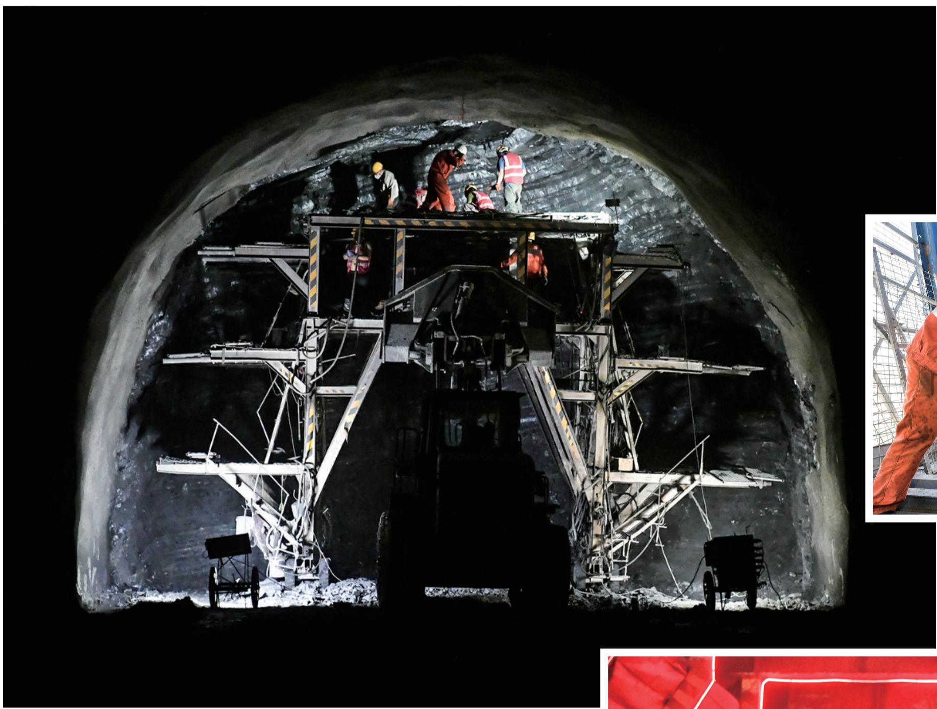
施工人员在慈利隧道内进行施工。

慈利隧道左线长5064米、右线长5044米,由中铁隧道局集团炉慈高速公路土建6标承担进口端3104米,目前左右线均已开掘超2200米。