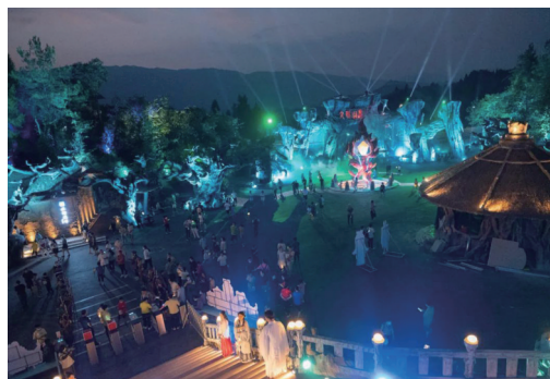
游人如织的《九歌 山鬼》。

除了沉浸式感受景区的演绎体验，《九歌 山鬼》文化景区还在溶洞里巧妙设置了九歌山鬼主题餐厅等，游赏完夜游大戏，正好在溶洞餐厅里品尝张家界特色宵夜美味，在欢乐梦幻之余，感受烟火人间的气息。