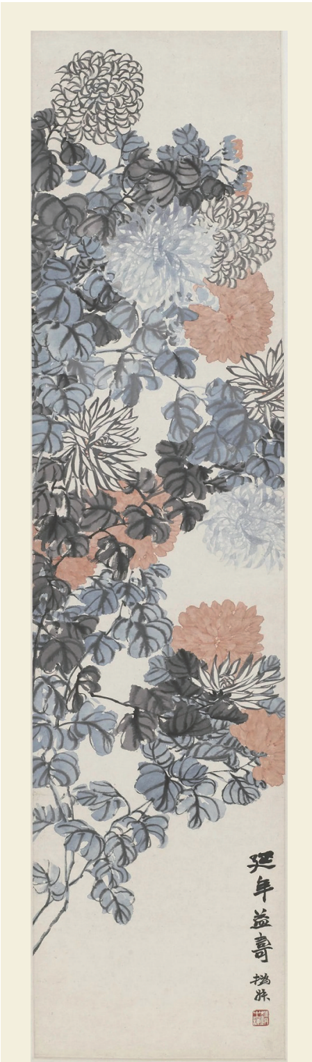
【清】赵之谦 菊花图轴 纸本 立轴 设色 133.5x32.6cm 上海博物馆藏