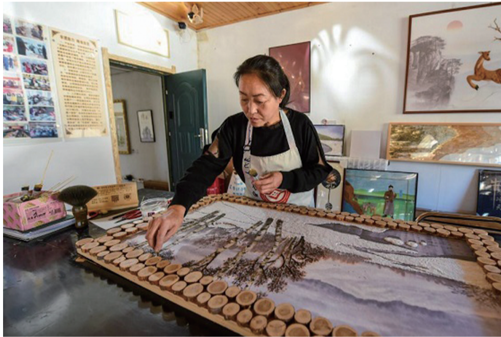
阿尔山市白狼镇的手艺人在制作桦树皮工艺品。

内蒙古兴安盟阿尔山市地处大兴安岭中段，以白桦树和松柏树为主的林木资源丰富。当地群众利用白桦树皮作画，辅以苔藓、干花、树叶等材料，通过剪、刻、雕、画等技法，制作出极具特色的树皮画。