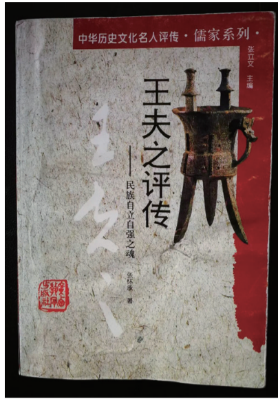
《王夫之评传 民族自立自强之魂》张怀承著 广西教育出版社

夫之评传》中讲述了王夫之的生平业绩和鸿篇巨制。为了实现远大志向，王夫之在青年时代关注时政，参与社会活动。明代崇祯十一年（1638年），衡阳县人王夫之就读岳麓书院，参加行社。翌年，组织匡社，旨在匡扶社稷。1642年，王夫之考中乡试举人。1648年，豪杰之士王夫之与管嗣裘等人在衡山发动抗清起义。战败以后奔赴广东肇庆，担任南明桂王政府行人司行人之职。在民族危机时刻，王夫之担负天下兴亡、民族复兴的重任，反抗清廷的民族压迫，表现知识分子的爱国主义情操。1654年，王夫之辗转至常宁西庄源，以六经责我开生面 自命，设馆授徒讲学，写成政论著作《黄书》，核心大义就是反对民族侵略。1660年，王夫之隐居在衡阳县金兰乡，虽然生存已有问题，但仍不为利禄所诱。1675年，又于衡阳县曲兰乡湘西村石船山修筑湘西草堂而居，著书立说。王夫之在乡隐居四十年期间，一边自立宗室，进行教学，维持艰苦生活；一边发愤著述，刻苦研究，就连写作纸笔都靠朋友周济。王夫之曾写一副对联表现民族气节：清风有意难留我，明月无心自照