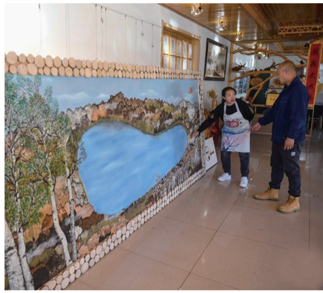
阿尔山市白狼镇的手艺人在展示新近制作的巨幅桦树皮工艺品。