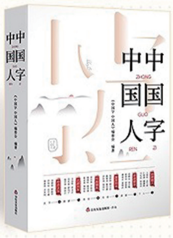
《中国字 中国人》本书编委会 编著 山东友谊出版社

本书通过直观的数据、典型的案例，反映了党的十八大以来中国经济的发展变化和辉煌成就，展现了中国经济迈向更高质量、更有效率、更加公平、更可持续、更为安全的发展之路。