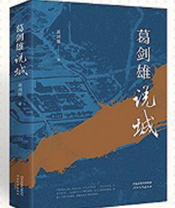
《葛剑雄说城》葛剑雄 著 河北教育出版社

本辞典是首部阐释非物质文化遗产相关理论、术语和保护实践，全面介绍中国非物质文化遗产代表性项目和代表性传承人，总体反映中国非物质文化遗产保护成就的专科辞典。全书由前言、凡例、目录、正文、附录、索引六部分组成，全书320余万字，收录辞条6636条。辞条规划和内涵阐释力求全面客观地反映中国非物质文化遗产的总体面貌，反映中国共产党领导全国各族人民保护非物质文化遗产的实践经验、理论探索和突出成就。