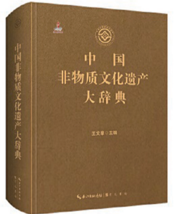
《中国非物质文化遗产大辞典》王文章 主编 长江出版传媒集团

本书以中国字为切入点，围绕自律助人、孝老爱亲、服务利他、节俭绿色、共建共享、和合大同六个主题，精选与之相应的107个汉字，通过小散文的形式讲解每个字的字形演变和字义内涵，展现中华文化的魅力与精髓。