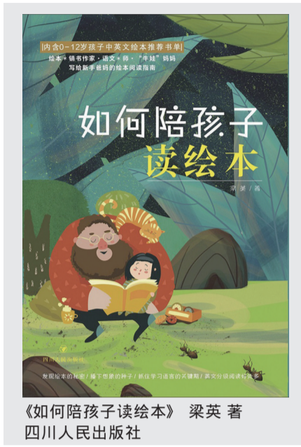
《如何陪孩子读绘本》 梁英 著 四川人民出版社