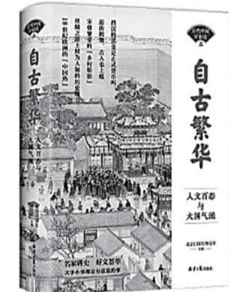
《自古繁华》 北京日报理论部 主编 北京日报出版社

本书是王蒙综合半生研思所得的感悟倾诉,分享了作者在数十年坎坷人生中,以乐观精神总结而出的肺腑之言。本书紧扣中国传统文化关键词,将作者数十年间凝聚而成的精华观点,分为天地、三才、混一、文治、修身、美德、君子、勤学、风度共十章,逐一加以深度阐述。本书已入选2022年主题出版重点出版物。