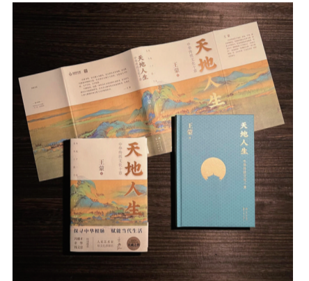
《天地人生:中华传统文化十章》 王蒙 著 江苏人民出版社

在推动中华优秀传统文化创造性转化、创新性发展的今天,如何深入理解中国文化,进而激发其内在活力,助力当代发展?该书对此多有思考。全书分别从认识与表述我们自己、从民族性格看中国文化、重新发现汉语之美、中国哲学与艺术精神、等不同角度聚焦这一问题,思路开阔,文字生动,多有闪光的思想火花。作者在论述中常常结合现实生活,把学术研究和世界万象打通,读来饶有生趣。