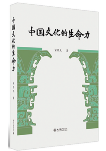
《中国文化的生命力》 宋修见 著 北京大学出版社

在推动中华优秀传统文化创造性转化、创新性发展的今天,如何深入理解中国文化,进而激发其内在活力,助力当代发展?该书对此多有思考。全书分别从认识与表述我们自己、从民族性格看中国文化、重新发现汉语之美、中国哲学与艺术精神、等不同角度聚焦这一问题,思路开阔,文字生动,多有闪光的思想火花。作者在论述中常常结合现实生活,把学术研究和世界万象打通,读来饶有生趣。