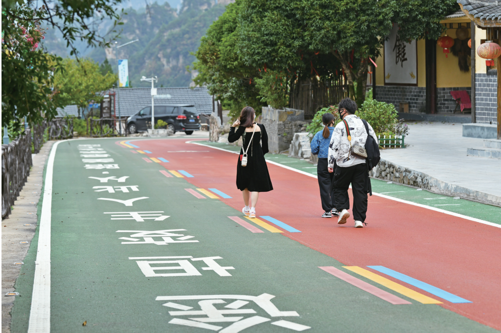
游客在插园公路上漫步。