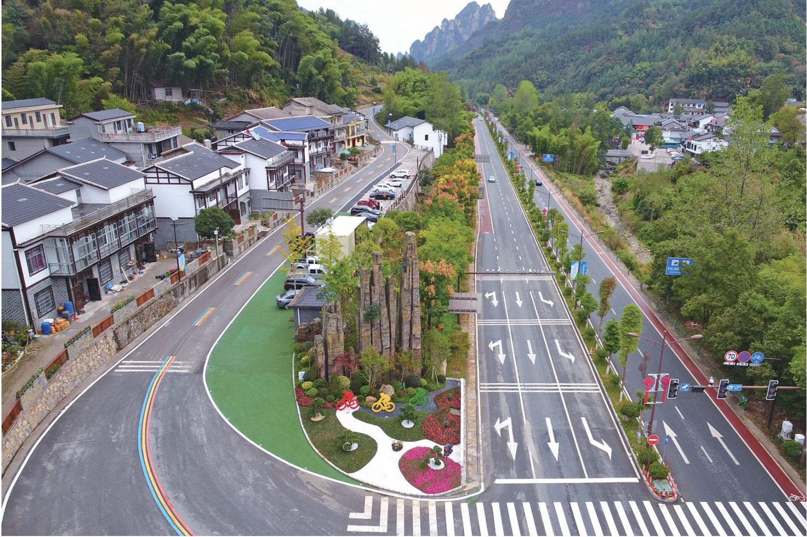
与武陵山大道交汇的插园骑行路。