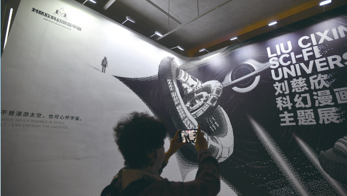
9月24日，参观者在刘慈欣科幻漫画宇宙主题展上拍照。