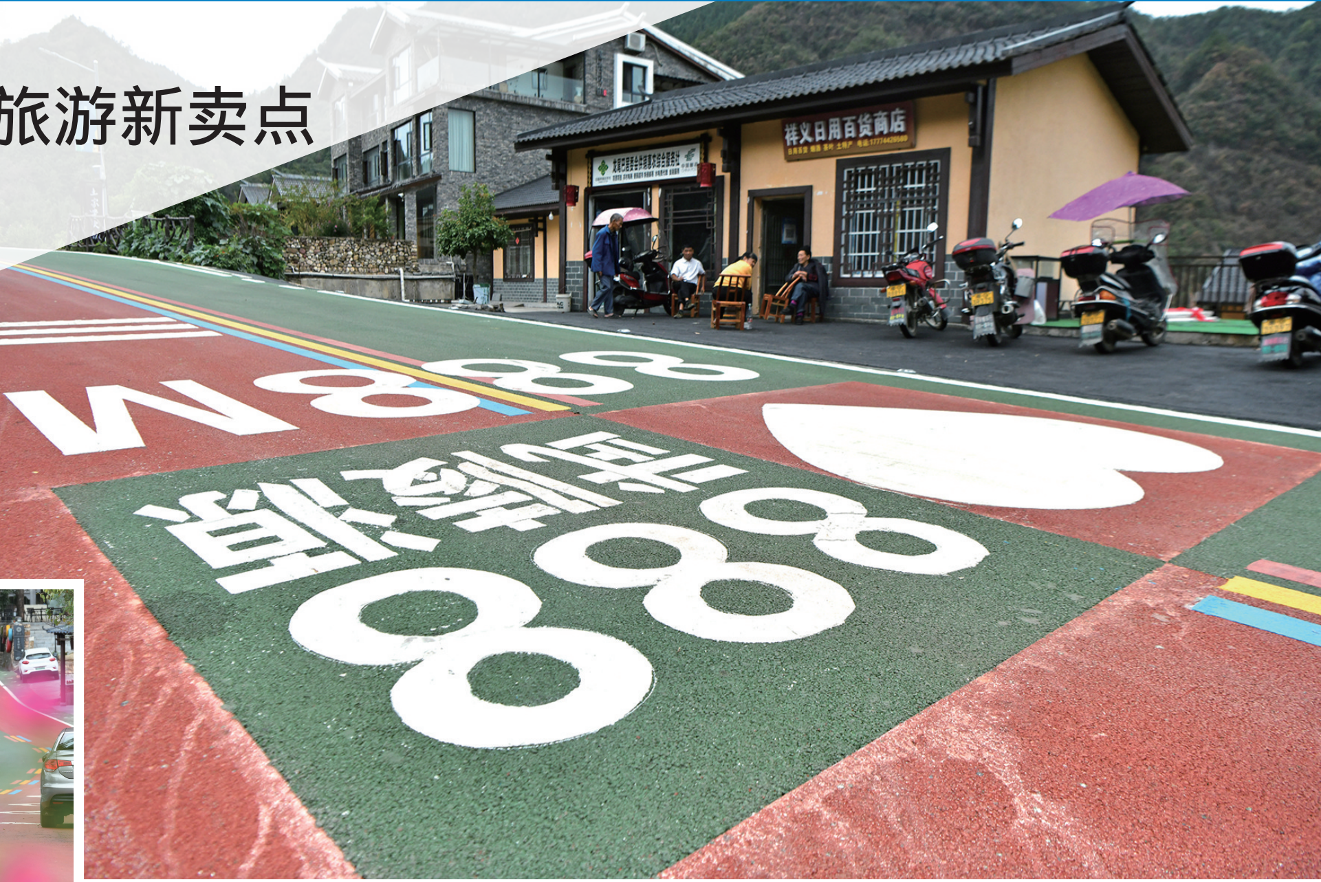
龙尾巴居委会距武陵源景区入口888米的特色路面标识。