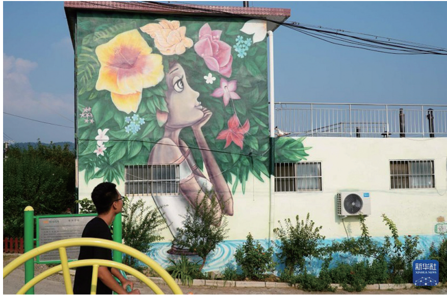
游客在北张村观赏墙绘艺术画。

近日,山东省泰安市岱岳区道朗镇北张村新增的60余幅大型墙绘艺术画全部绘制完成,全村大型墙绘艺术画达100余幅。北张村从2018年开始将整治村庄环境与墙绘艺术画相结合,多彩墙绘成为该村特色,吸引不少游客前来观赏,推动了该村特色民宿和餐饮业的发展。