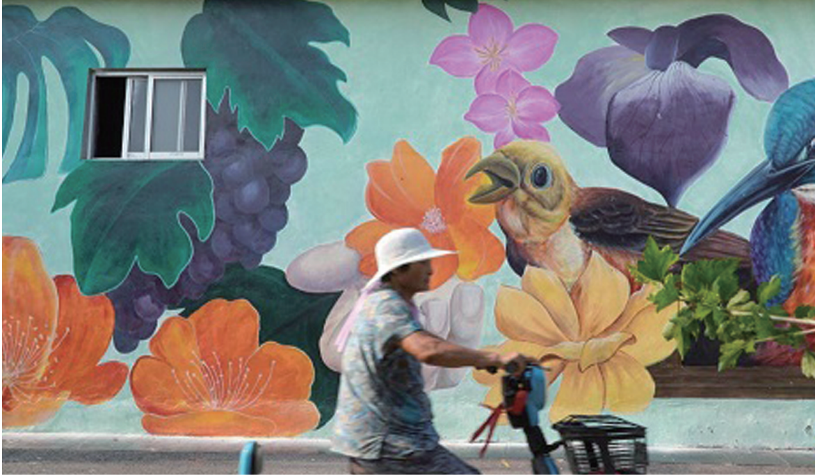
北张村村民从墙绘艺术画前经过。