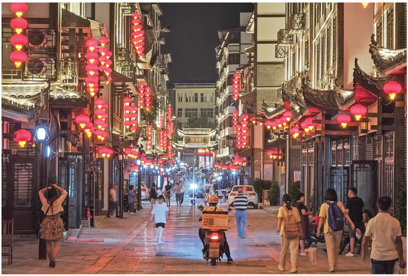
古朴典雅的后溶街巷。

华灯初上，市民和游客徜徉在流光溢彩的夜景世界中，这一抹靓丽的色彩也是张家界夜生活的开始。七十二奇楼灯光秀绚丽多彩，成为众多游客和市民的打卡之地；新落成的旅游商品产业园在充满科技感的灯光辉映下彰显着活力；凤湾桥下灯火辉煌，让每一位来此观赏的市民流连忘返；改造后的后溶街古朴典雅，缓步走进街巷，恍若走进了历史