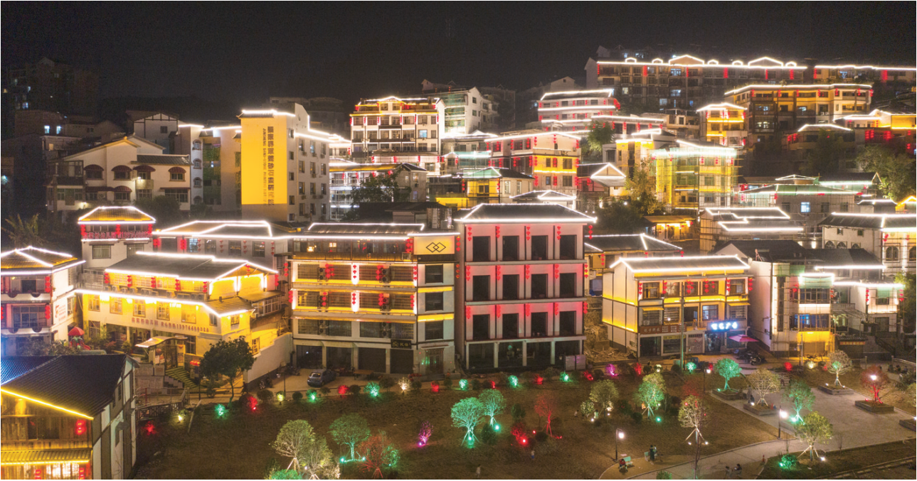
灯火辉煌的凤湾夜景。