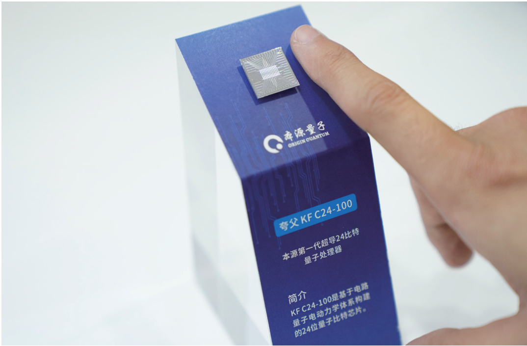
这是9月17日在2022年全国大众创业万众创新活动周合肥主会场的主题展上拍摄的量子处理器。

2022年全国大众创业万众创新活动周于9月15日至9月21日举行，本届活动周以“创新增动能，创业促就业”为主题。主会场安徽合肥举办主题展，设置展位160多个，以实物展品、虚拟现实、线上直播等形式，为创新创业者提供展示平台。