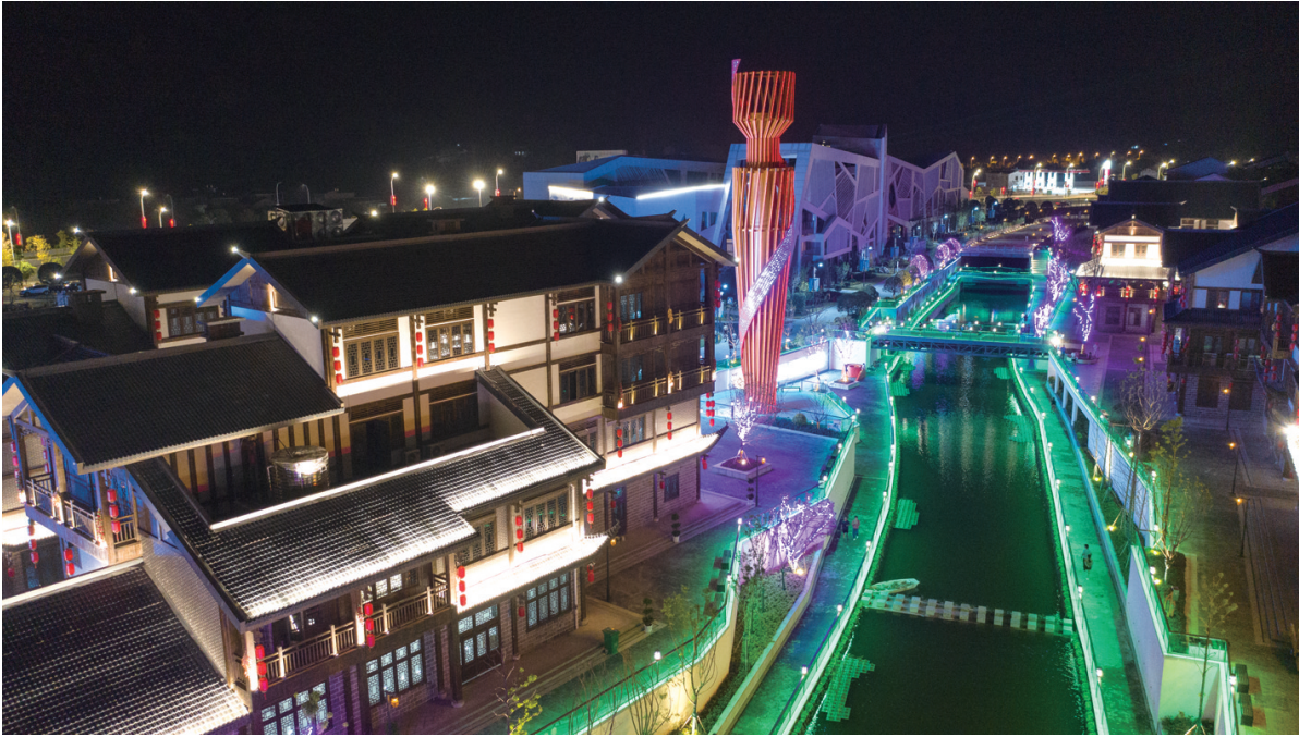
流光溢彩的旅游商品产业园。