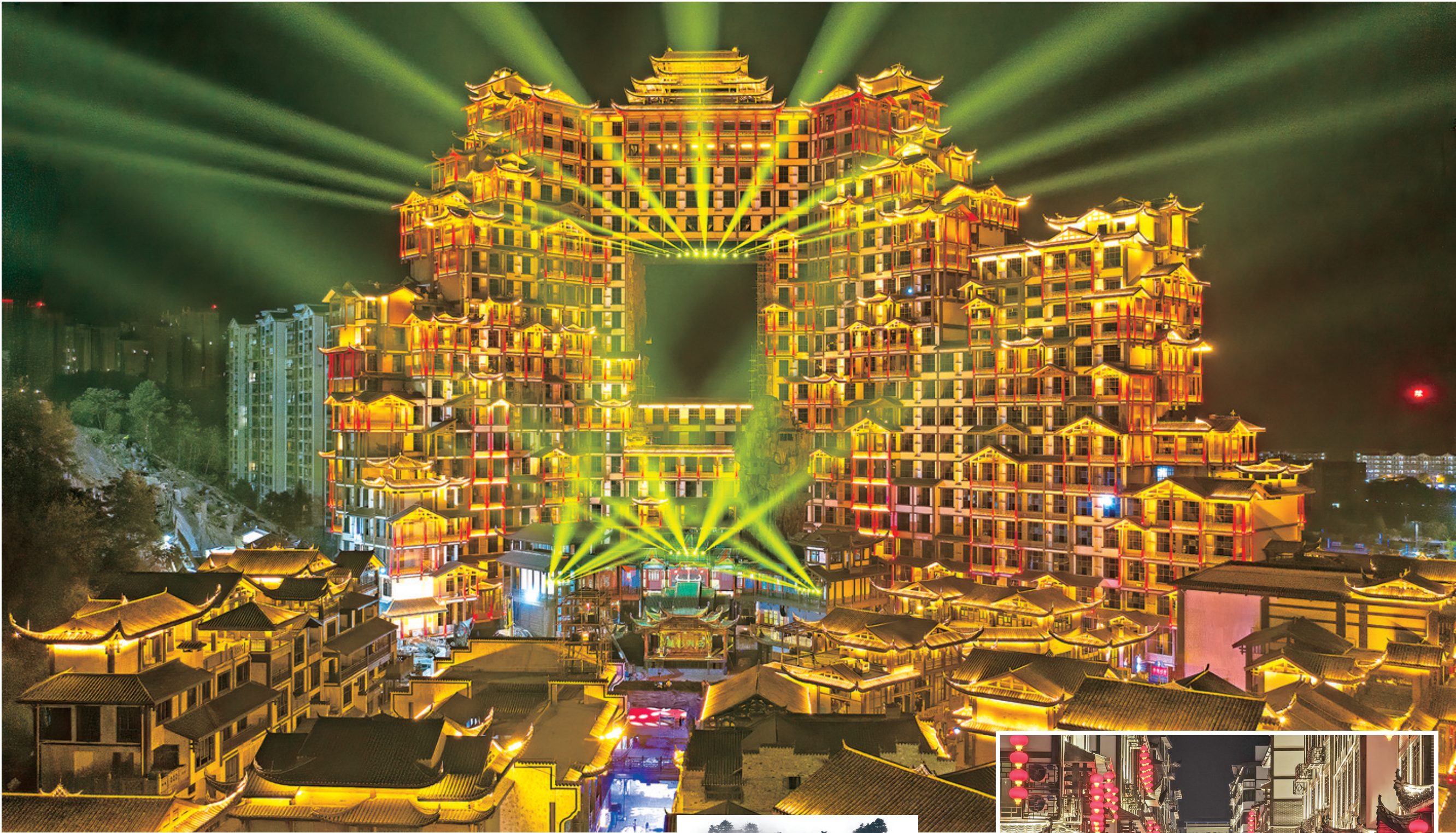
绚丽多彩的七十二奇楼灯光秀。