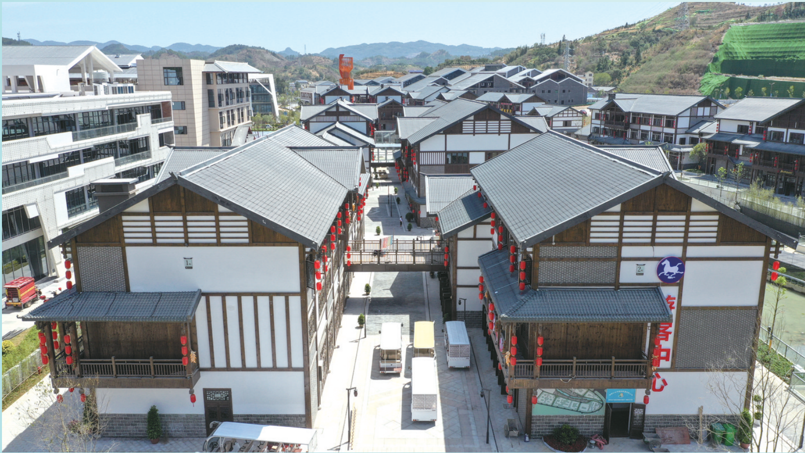
张家界旅游商品产业园一角。