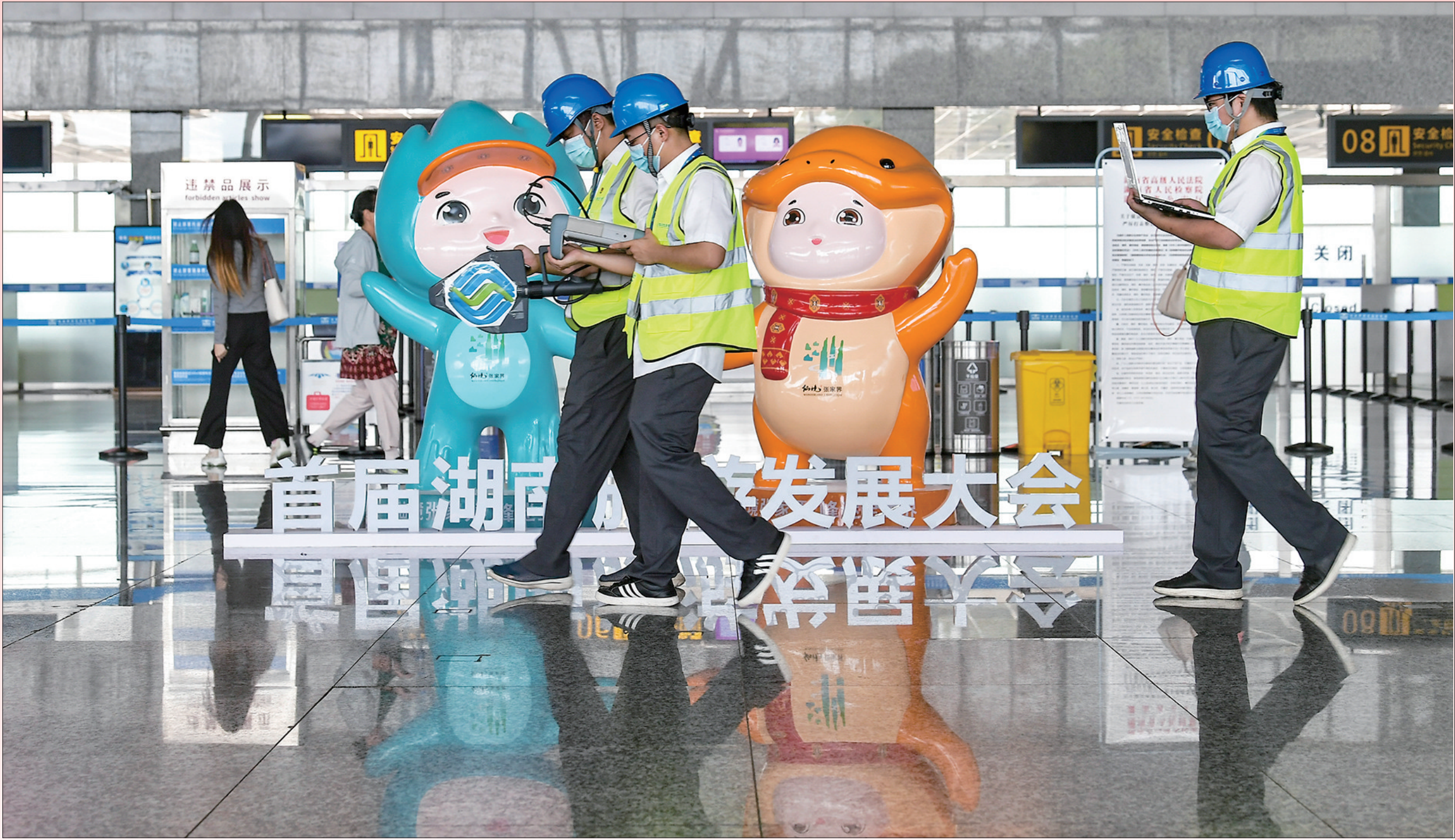
8月24日，网络优化测试工程师在张家界荷花国际机场对4G和5G的网络性能进行测试。