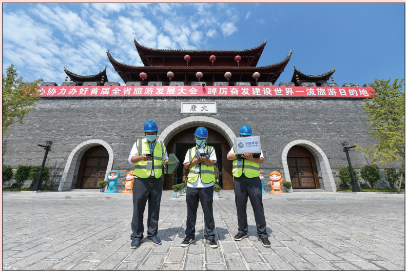
8月24日，网络优化测试工程师在大庸古城对4G和5G网络性能进行测试。

为保障首届湖南旅游发展大会顺利召开，张家界移动从网络结构、网络覆盖、网络容量、网络体验等方面全力做好需保障区域网络深度优化和动态应急机动保障，助推大会网络服务保障成效转化，为5G+旅游新业态 立标打样。截至目前，张家界移动已完成市民广场、碧桂园凤凰酒店、纳百利皇冠假日酒店、阳光酒店、大庸古城、梓山漫居、七十二奇楼等重点保障场所和武陵源、天门山、大峡谷、七星山等5A/4A景区以及张家界荷花机场、张家界西站等主要交通枢纽和重要交通道路等区域网络深度覆盖部署，全力提供 安全、稳定、优质、高效 移动精品通信网络服务保障，为旅发会顺利召开精心护航。