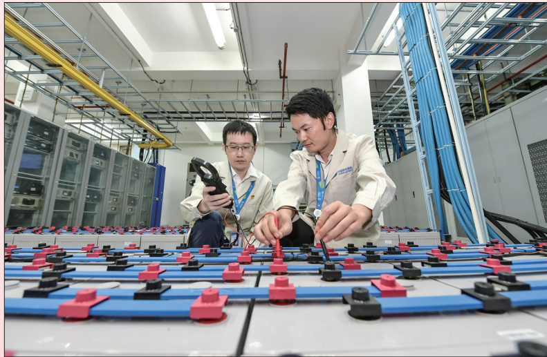
8月24日，网络运维工程师正在用钳形万用表测试通信后备电源所属蓄电池组在网运行情况。