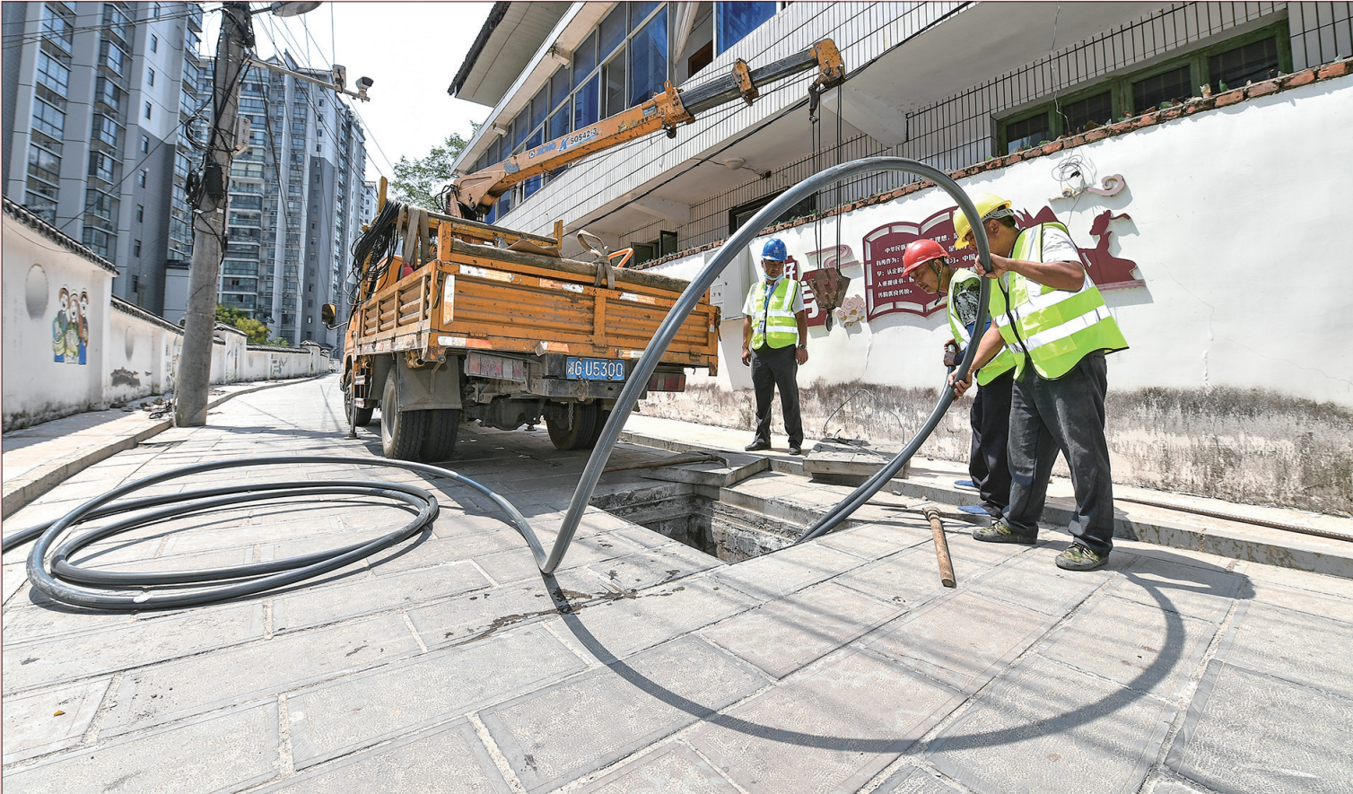
8月24日，施工人员正在进行空中弱电杆线整治建设施工。