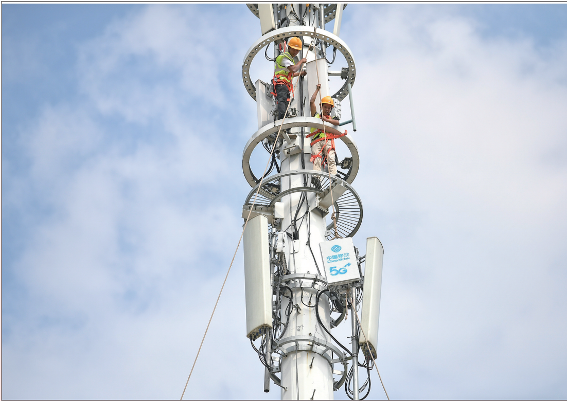
8月24日，施工人员正在空港新城安装移动5G基站。