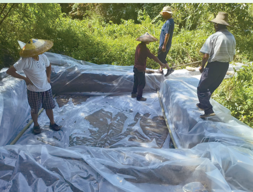
张家界乡滋味农产品开发有限公司帮助桑植县八大公山镇朝南坪村村民搭建临时蓄水池。