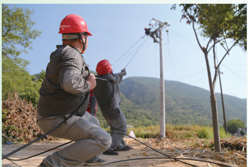
国网张家界供电公司员工冒着40度高温，为慈利县风自洞蔬菜种植专业合作社架设抗旱灌溉用电专线，保障1200多亩农作物灌溉用水。