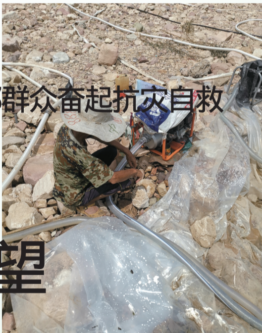
烈日下守水灌溉。