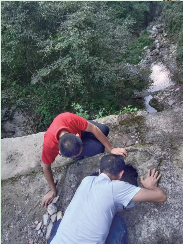
桑植县洪家关白族乡党员干部到深山寻找水源。