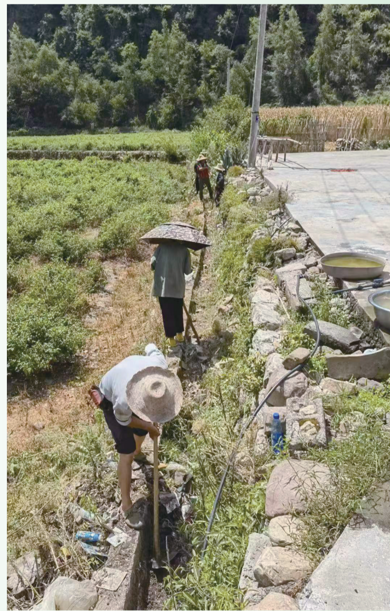
永定区罗塔坪乡组织干部群众清沟渠引水。