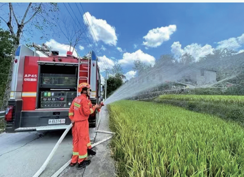
武陵源区消防救援站为中湖乡居民和庄稼送去酷暑中的一丝清凉。