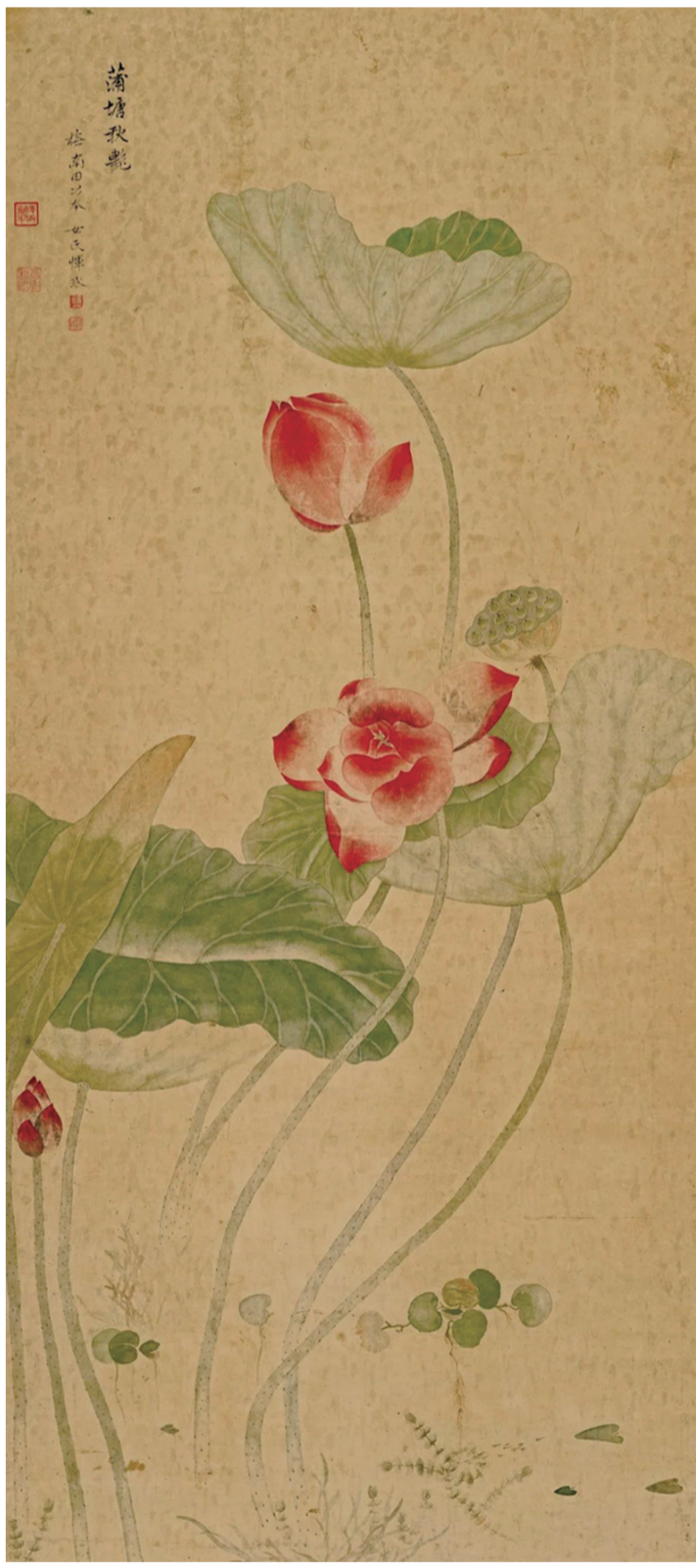
清 恽冰 蒲塘秋艳图

《蒲塘秋艳图》，纸本设色，126.4 56.4cm，现藏于北京故宫博物院。画面左上方有题跋云：蒲塘秋艳。抚南田公本。女史恽冰。下钤白文 恽冰 及朱文 清于。题跋左侧有朱文 养拙道人 珍玩、朱文 少大私印 两方鉴藏印。画面描绘了秋日荷塘的一角，几枝荷花在绿荷的环绕中袅娜地生长。作者熟练运用没骨技法，对物像外形的把控也十分准确。整幅画构思精巧、技法纯熟，是恽冰传世花鸟画中的一件佳作。