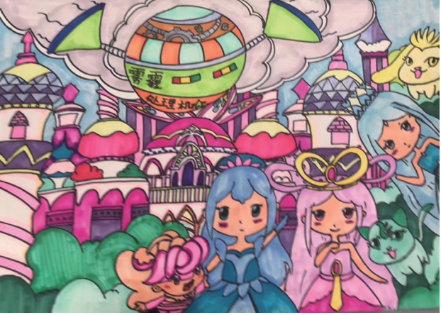
童话王国的低碳生活 葛秋希 画 (张家界崇实小学南校二6班 指导老师：张曼花)