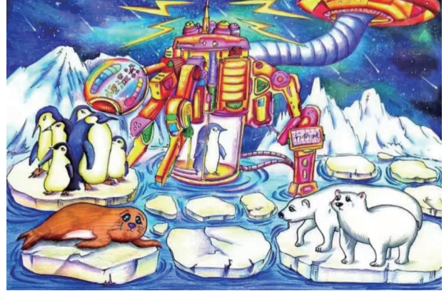
气温调节器 舒筠娴 画 (张家界崇实小学南校二6班 指导老师：张曼花)