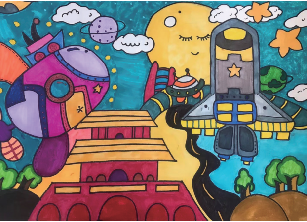
梦中的太空城堡 吴卓恩 画 (张家界崇实小学南校二6班 指导老师：张曼花)