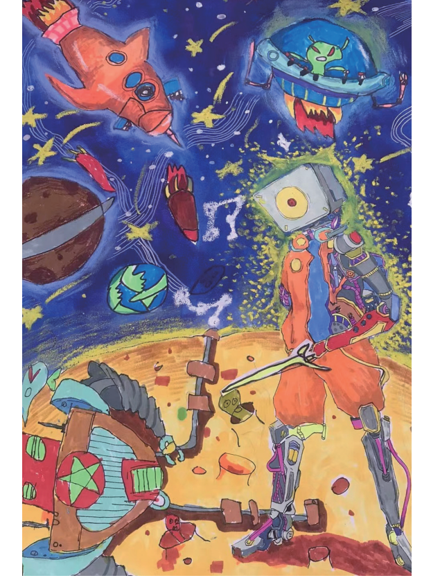
宇宙大作战 樊启源 画 (张家界崇实小学南校二6班学生 指导老师：宋海红)