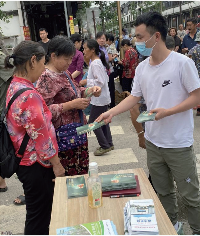
镇政府工作人员在集镇给群众发放反诈骗宣传资料。