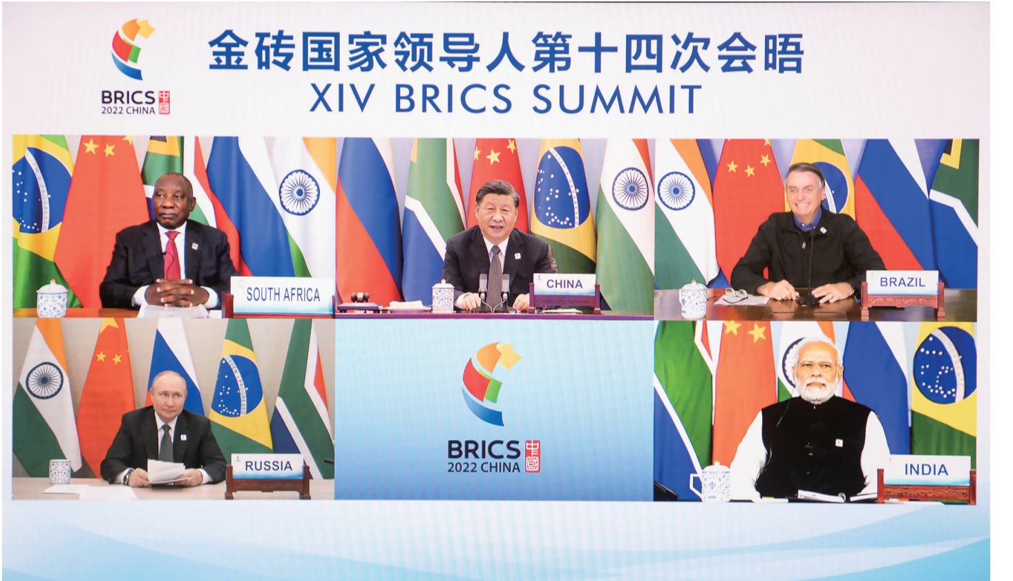
6月23日晚，国家主席习近平在北京以视频方式主持金砖国家领导人第十四次会晤并发表题为《构建高质量伙伴关系 开启金砖合作新征程》的重要讲话。南非总统拉马福萨、巴西总统博索纳罗、俄罗斯总统普京、印度总理莫迪出席。