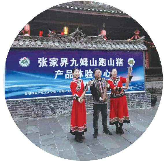
从旅游业转型过来的员工在直播推销黑山猪肉。