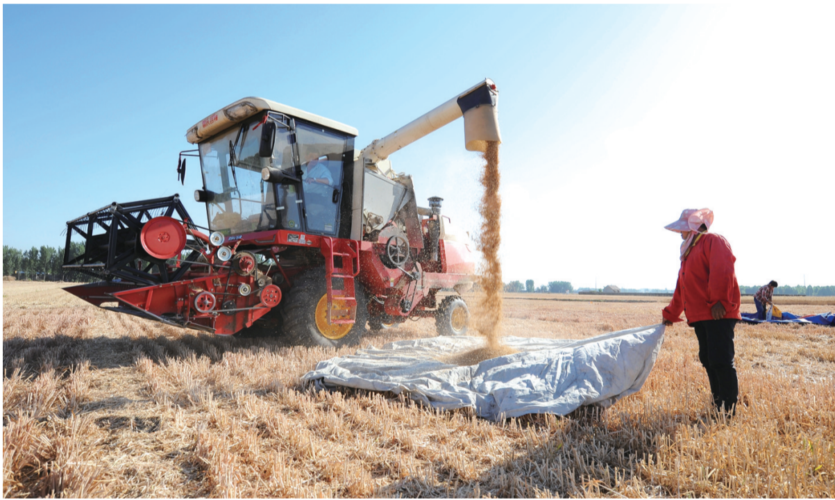
↑6月7日，在山东省滕州市鲍沟镇宋庄村，农民趁着晴好天气收获小麦。