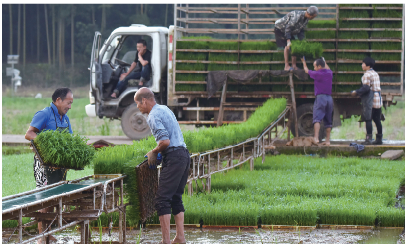
←6月7日，浙江省武义县王宅镇仁村育秧工厂为农户装车运送水稻秧苗。