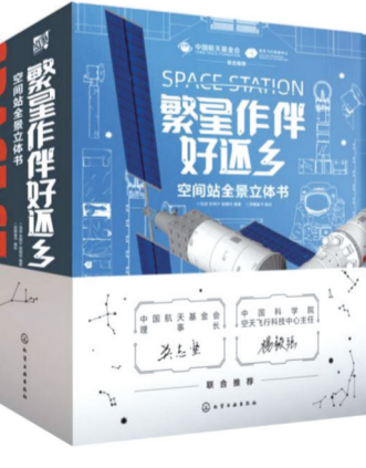
《繁星伴件好还乡 空间站全景立体书》 汤波 史小宁 顾璐璐 编著 派糖童书 编绘 化学工业出版社

散文集《格桑花姿态姿势》记录了作者在不同人生阶段对生命、文学、历史、现实的思考，既有唤醒内心深处最细腻情感与记忆的叙事散文，又有针对当代文化现象、文学创作提出问题的思想随笔。作者在理论研究与随感写作间自由游转，文体风格变得越发丰富多元，文本内容的呈现便是作者倾诉个人体验、思索问题与寻觅答案的过程。