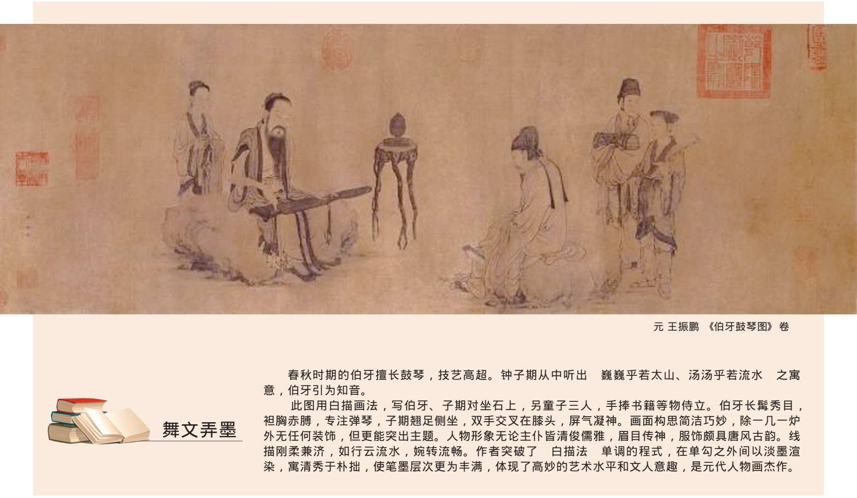
元 王振鹏 《伯牙鼓琴图》卷

春秋时期的伯牙擅长鼓琴,技艺高超。钟子期从中听出 巍巍乎若太山、汤汤乎若流水 之寓意,伯牙引为知音。