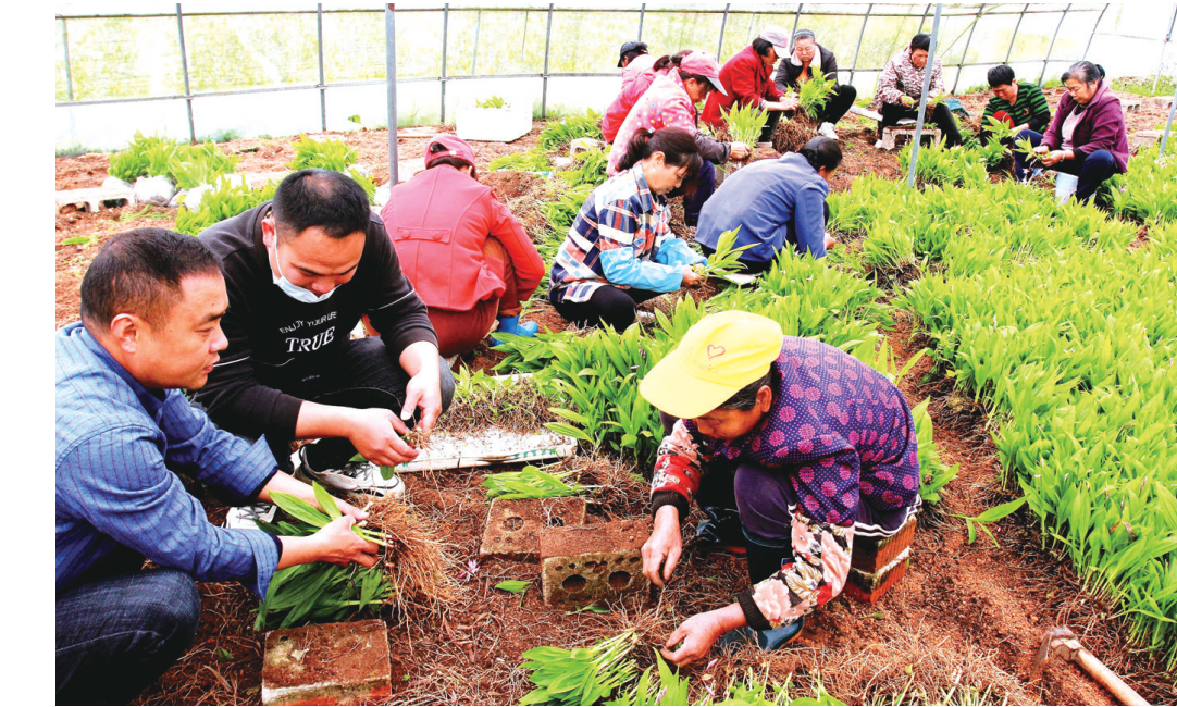
合作社务工人员正在起扯出售的白芷幼苗。