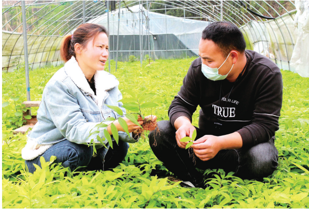
合作社负责人（左）在向客户介绍黄精幼苗管护情况。