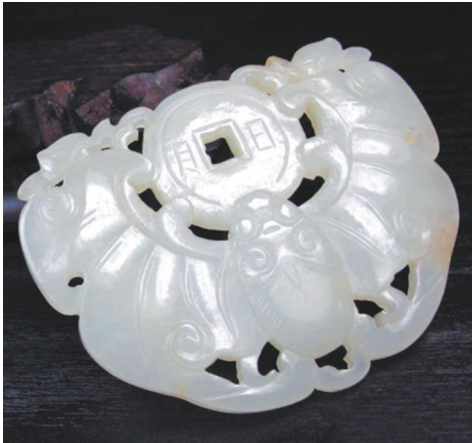
清初福在眼前白玉佩。

因此，玉器收藏者要逐步学会鉴定。要多学习和研究，单纯的看书是没有用的，要多实践，多看真假的物件，摸索出两者的区别，还要多听专家讲座，请教懂行的前辈。学习玉器鉴定知识不是一天两天就能练成的，它是一个很漫长的过程，要靠慢慢积累，只有掌握足够的鉴定知识才能避免收藏中的“打眼”。