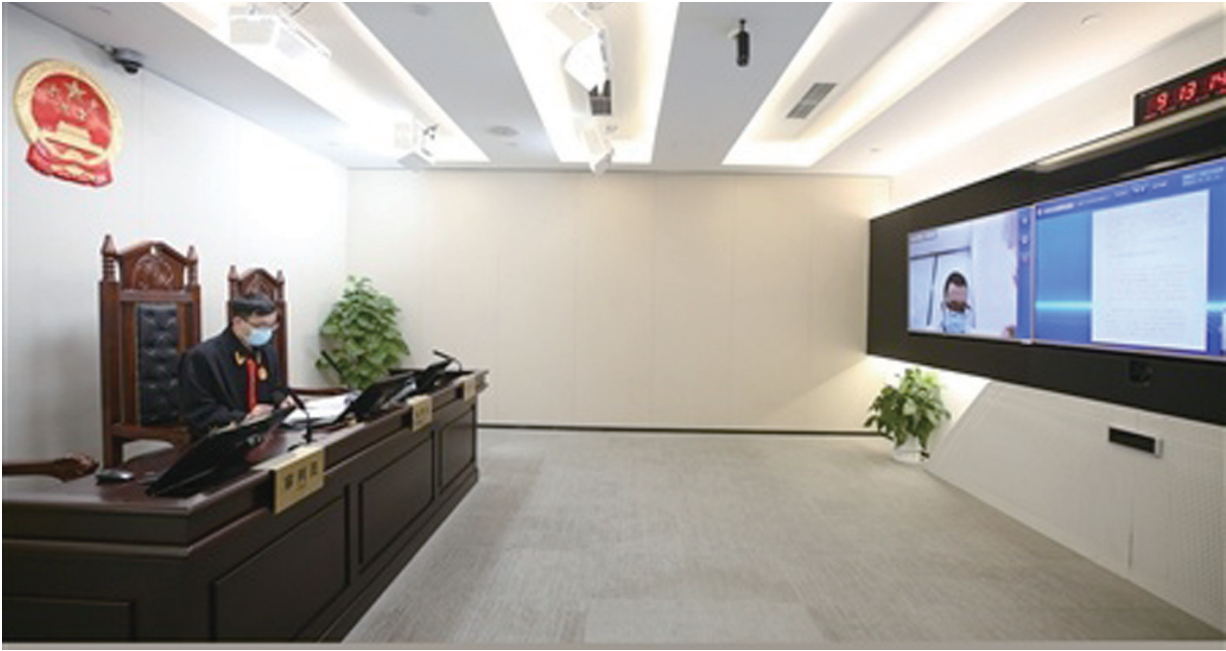
北京互联网法院法官在审理案件。