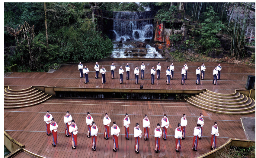
3月7日，武陵源区举办 旗袍秀迎三八 主题活动。在宝峰湖景区，旗袍爱好者迈着优雅的步伐，在山水、花田间展示旗袍服饰的魅力。