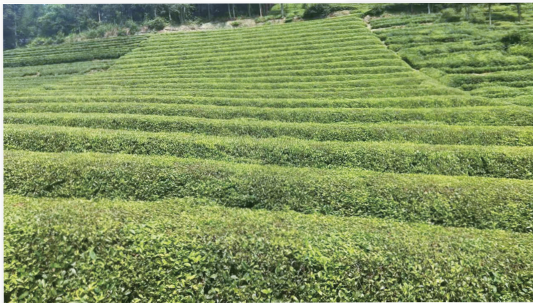
水流村千亩白茶基地。