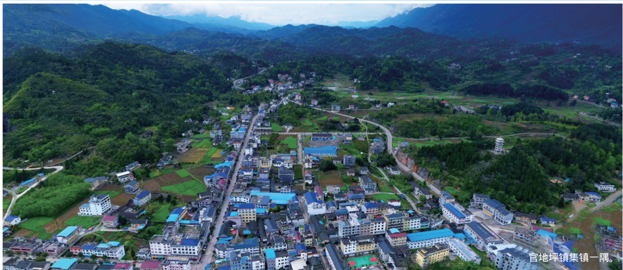
官地坪镇集镇一隅。

2022年，官地坪镇党委、政府将坚决按照县委确定的335总体发展思路，落实好县政府5510工作举措，勇于担当，主动作为，全面争先创优，全力争资跑项，全速推进项目，为桑植县高质量发展贡献力量。