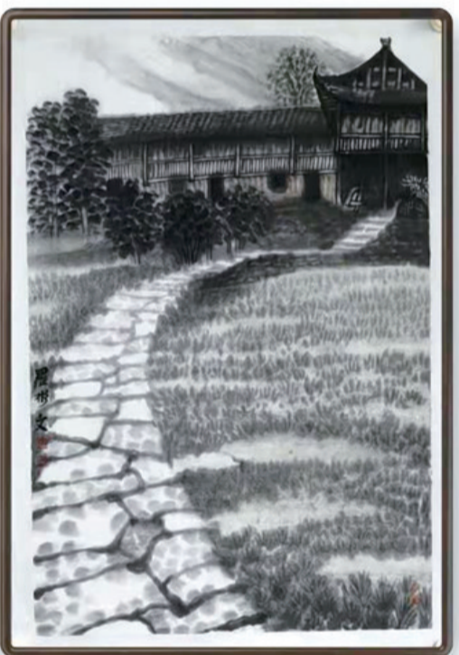
《路》创作系列 中国画 尺寸182cmx68cm

道路 时光的记忆 大地的皱纹 迷途的读者 将读出不同的华章 你或许疲惫，或许迷茫 但只要转身 就会看见我疯狂的思想 图/罗彬 文/朱岚武