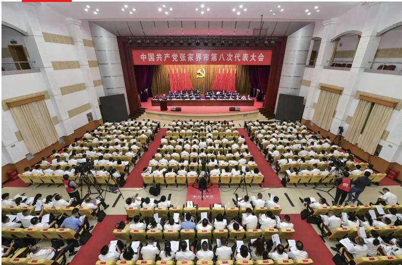
中国共产党张家界市第八次代表大会现场。

2021 年 9 月 27 日至 29 日，中国共产党张家界市第八次代表大会召开，选举产生了新一届中国共产党张家界市委员会，明确提出加快建设世界一流旅游目的地、奋力谱写现代化建设张家界新篇章。