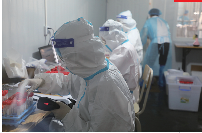
医护人员坚守岗位抗击疫情。

2021 年 7 月下旬至 8 月下旬，面对建市以来最严峻、最危急的新冠肺炎疫情，全市人民众志成城，合力抗疫，守住了疫情外溢底线，实现了一个全周期内疫情 清零 目标。期间，《致居住在张家界游客朋友的一封信》《张家界：我的不舍你一定会懂》全网破防，登上热搜。