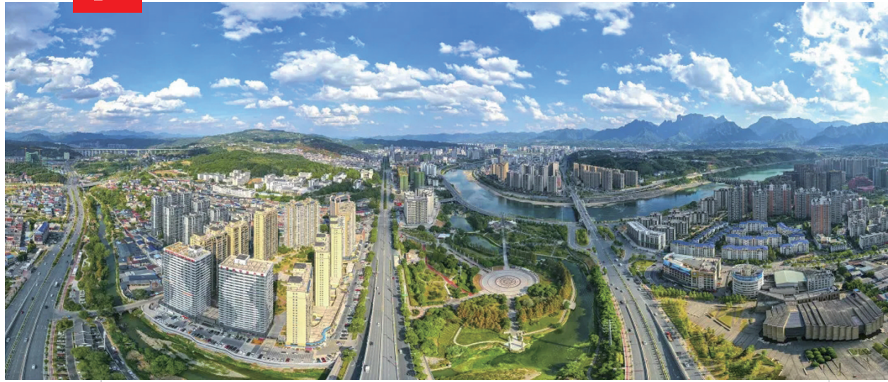
蓝天白云下的张家界市城区全貌。

2021 年 1 月，全国爱国卫生运动委员会公布 2018-2020 周期国家卫生城市（区）命名名单，我市荣获 国家卫生城市 称号。