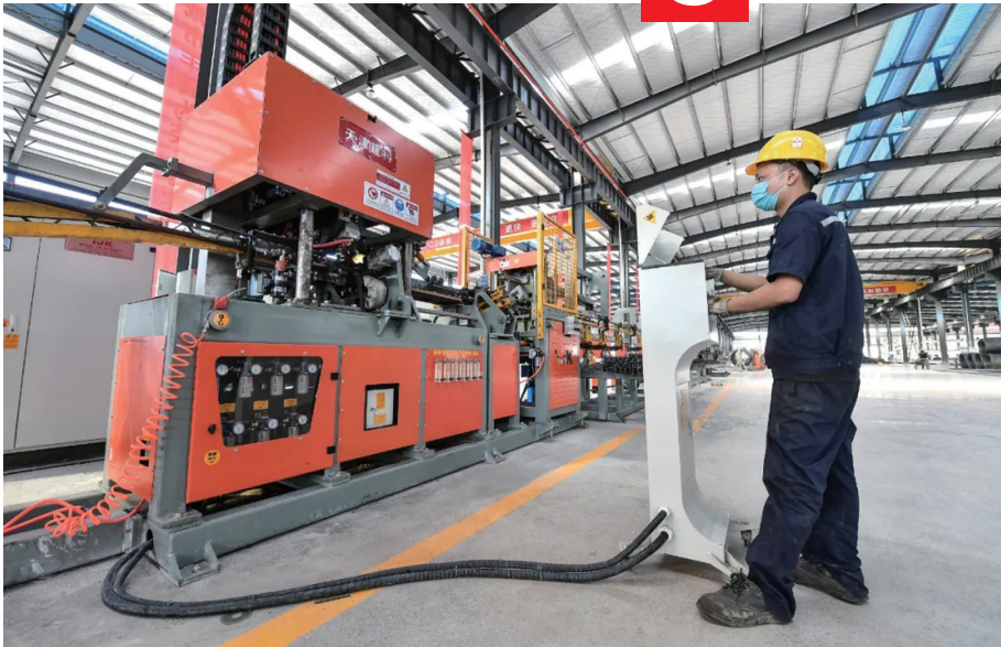
2021 年 9 月 8 日，张家界万众实业集团有限公司工人在进行钢筋桁架加工。

2021 年 4 月 21 日，我市出台《张家界市新型工业强基倍增计划三年行动方案（2021-2023 年）》，围绕总量倍增、基础加强、质量提升目标，着力培育旅游商品、生物医药、绿色食品、旅游装备、绿色建材、信息与数字技术等六条产业链，大力发展 六个一 特色产业，培育综合产值过百亿的产业，加快形成具有旅游城市特色的现代化工业产业体系。