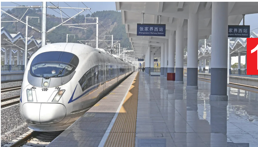
2021 年 12 月 6 日，张吉怀高铁开通后，首趟列车驶入张家界西站。

2021 年 12 月 6 日上午，张家界经吉首至怀化高速铁路正式开通运营。张吉怀高铁是我国 八纵八横 高速铁路网的区域连接线，北接黔常铁路，南连沪昆高铁、怀邵衡铁路，全长 245 公里，设计时速 350 公里，串联起武陵源、天门山、芙蓉镇、矮寨大桥、凤凰古城、洪江古商城等众多著名景区，被誉为 最美高铁。