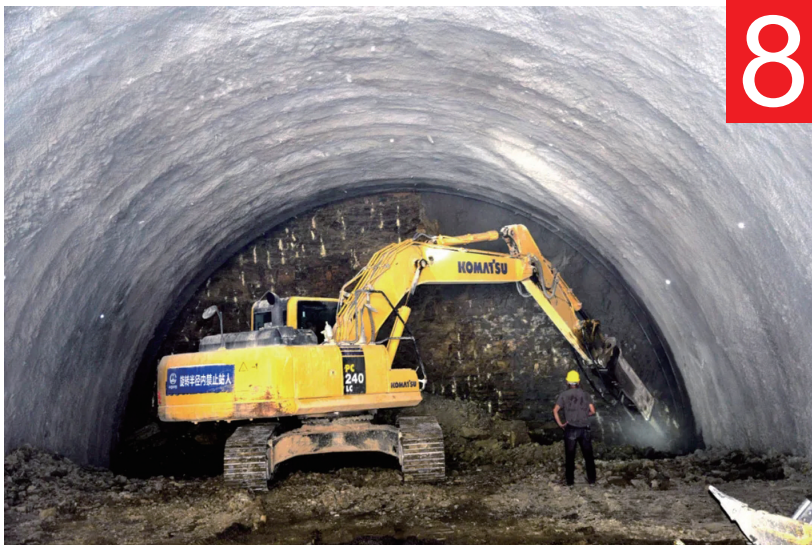
炉慈高速慈利隧道建设现场。

2021 年，以项目建设为推进经济高质量发展的主要抓手，96 个重点项目分三批次集中开工，5 个 省十大基础设施项目 顺利完成，33 个省重点项目完成年度任务的 121%。