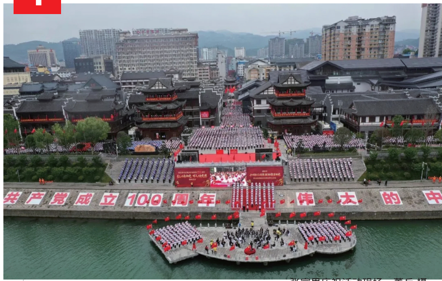
张家界庆祝活动现场。

2021 年，举行 两优一先 表彰大会、红心永向党 万人颂党恩 群众性歌咏活动和 永远跟党走 文艺晚会，为老党员颁授 光荣在党 50 年 纪念章等，弘扬伟大建党精神，激励全市上下凝心聚力谋发展，携手奋进新时代。