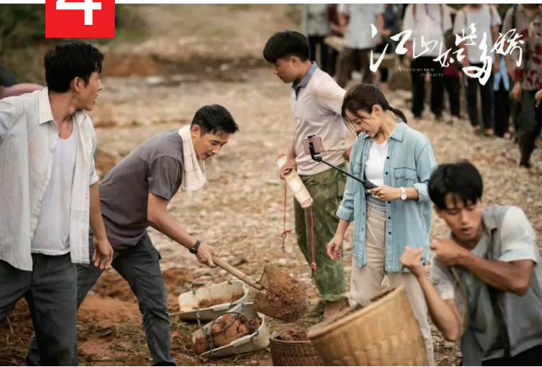
《江山如此多娇》电视剧剧照。

张家界市委市政府联合湖南广播影视集团等摄制、以我市为主要拍摄地的新时代脱贫攻坚题材电视剧《江山如此多娇》，于 2021 年 1 月 10 日作为开年大剧登陆湖南卫视金鹰独播剧场，芒果 TV 同步上线，成为讲好中国脱贫攻坚故事的精品，有力带动我市乡村旅游及相关产业发展。