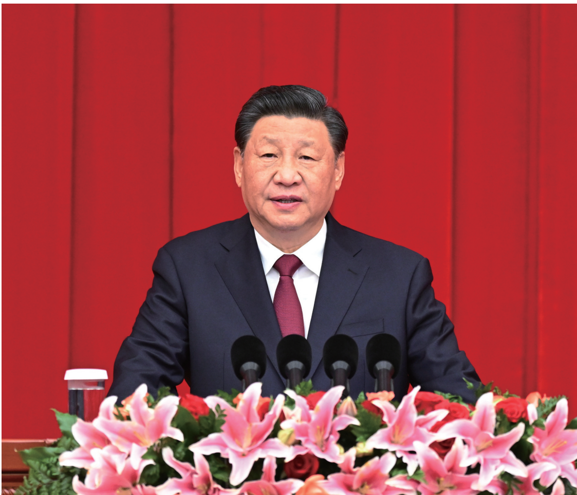
2021年12月31日，全国政协在北京举行新年茶话会。中共中央总书记、国家主席、中央军委主席习近平在茶话会上发表重要讲话。