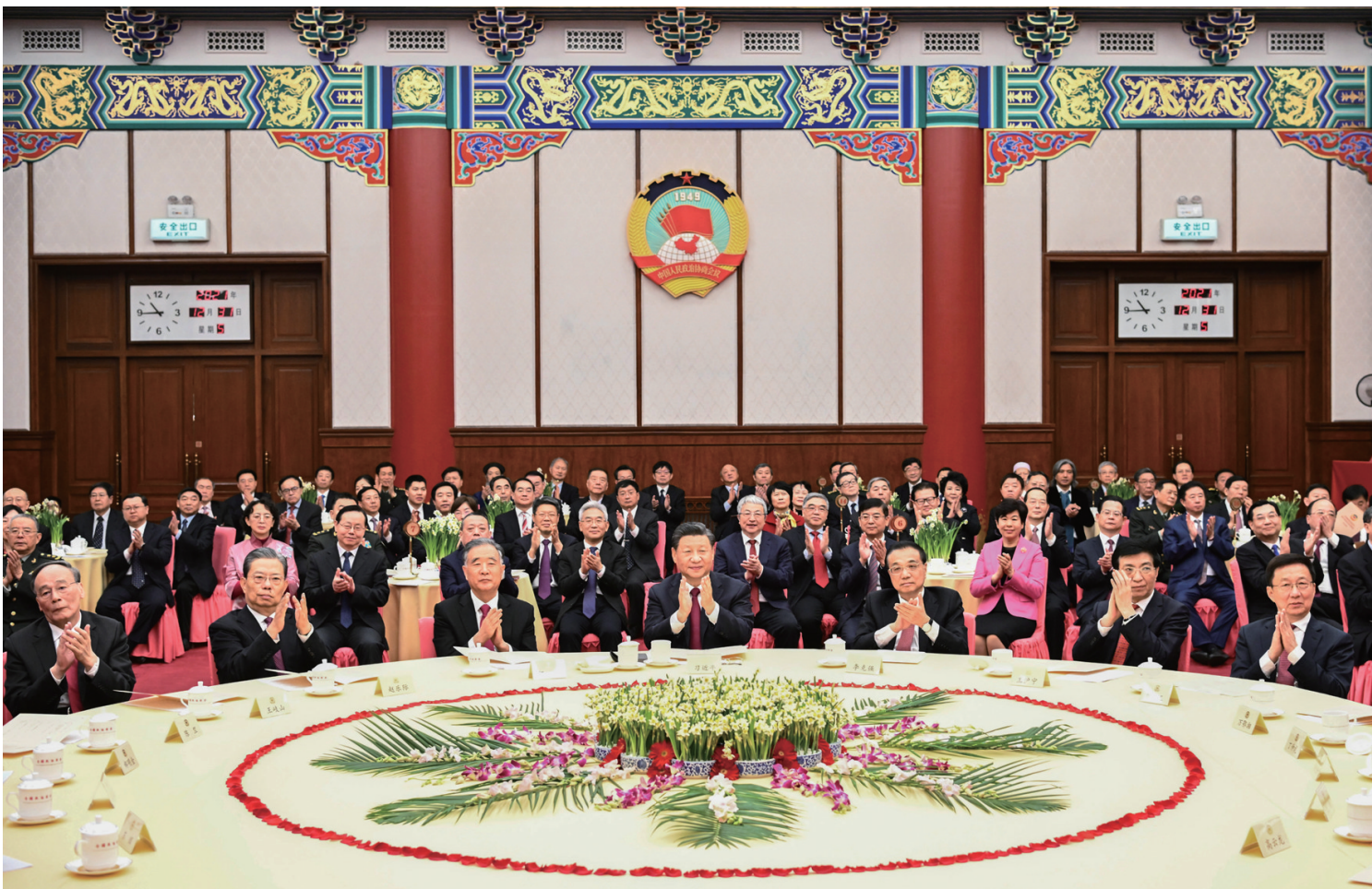
2021年12月31日，全国政协在北京举行新年茶话会。党和国家领导人习近平、李克强、汪洋、王沪宁、赵乐际、韩正、王岐山出席茶话会并观看演出。

新华社北京2021年12月31日电 中国人民政治协商会议全国委员会12月31日上午在全国政协礼堂举行新年茶话会。党和国家领导人习近平、李克强、汪洋、王沪宁、赵乐际、韩正、王岐山等同各民主党派中央、全国工商联负责人和无党派人士代表、中央和国家机关有关方面负责人以及首都各族各界人士代表欢聚一堂，共迎2022年元旦。