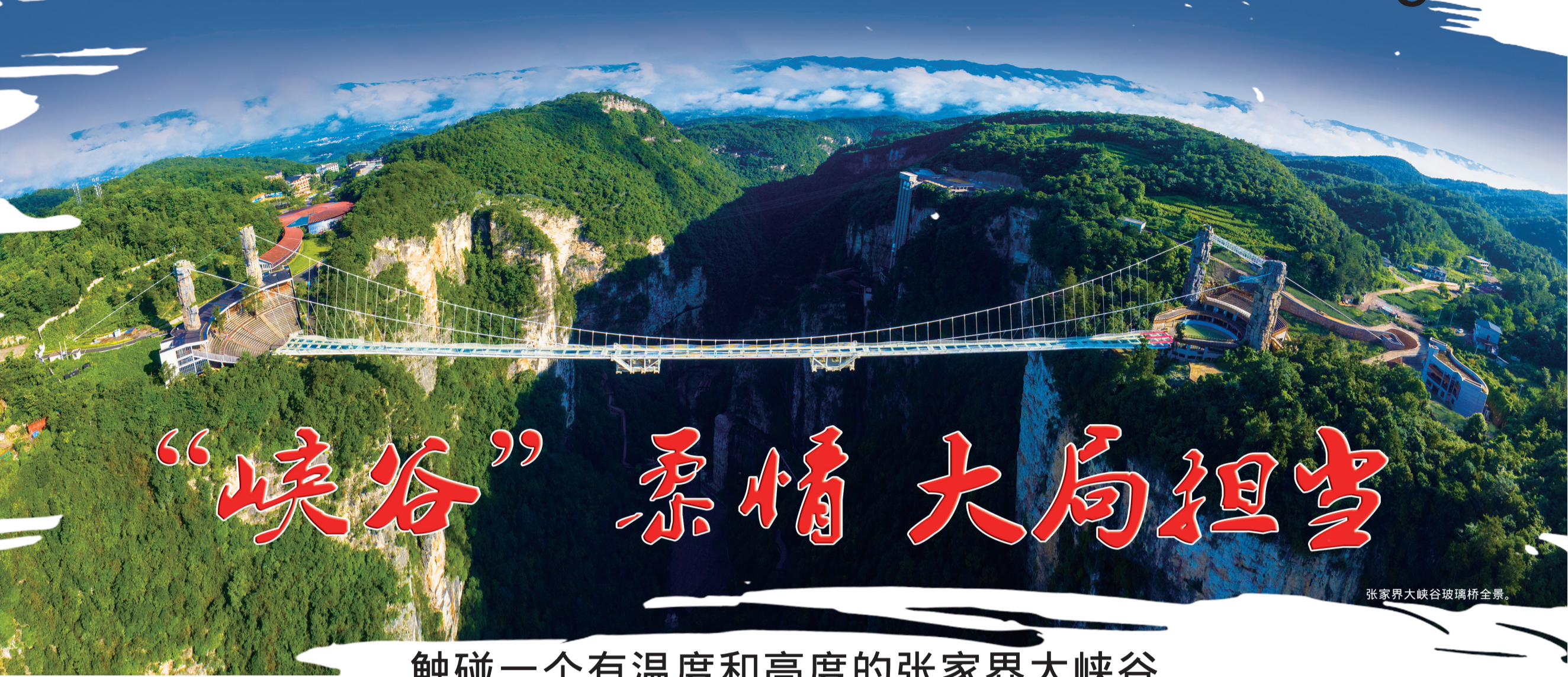
张家界大峡谷玻璃桥全景。