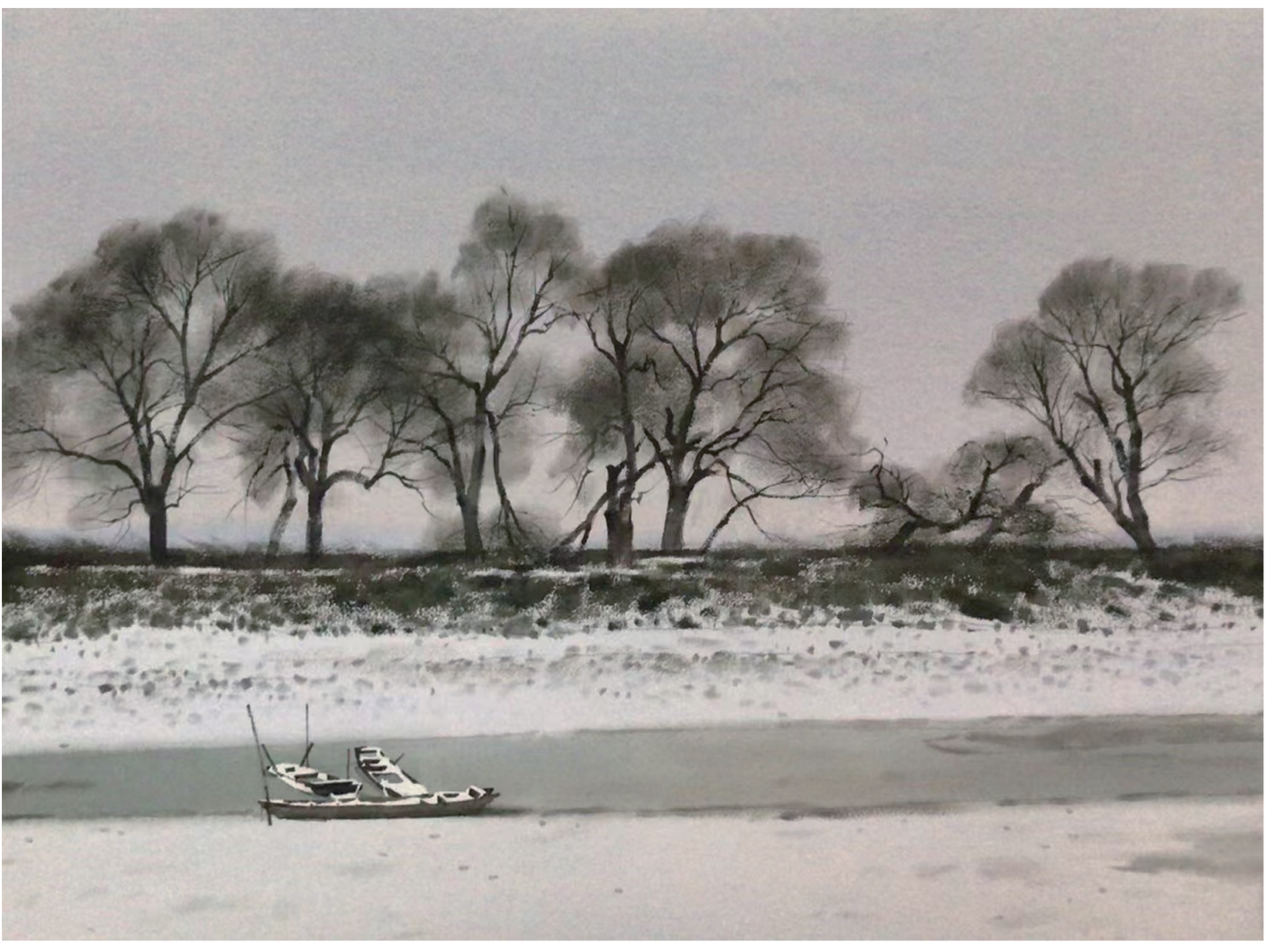
洞庭冬雪 水彩画 55cm 75cm

隆冬时节的江南，即使下雪，雪也是薄薄的一层，不像北方那样酣畅淋漓。用明丽的水彩来画南方的雪景，需要更为高超细腻的艺术表现手法。这幅《洞庭冬雪》中，我们可以发现以中国水墨意境与笔法入画的方式似乎更为明显，水墨点提晕染的层次感更为分明。作品在明暗布局上十分讲究，大片空白的雪地、几只覆盖着奶油一般的白雪的小船、结着薄薄一层冰的水面，水墨浓淡相宜，与色彩深沉的河岸和岸柳形成鲜明的反差。正如唐 杜甫《岁晏行》诗：岁云莫倚多北风，潇湘洞庭白雪中。 此时的洞庭水乡，美在尘世的对岸，那么洁净、静谧、安详。