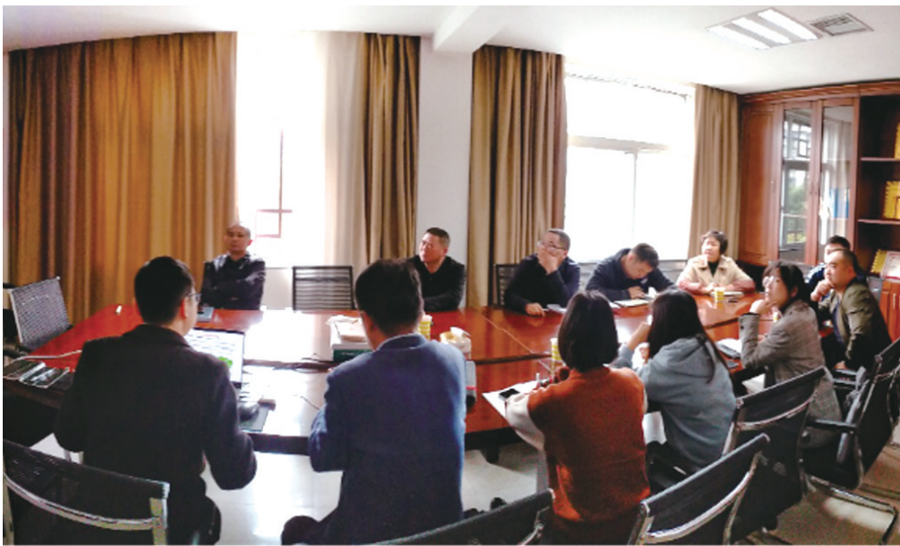
双评价工作推进会议为三区三线划定和本次国土空间总体规划编制工作提供了根本保障。