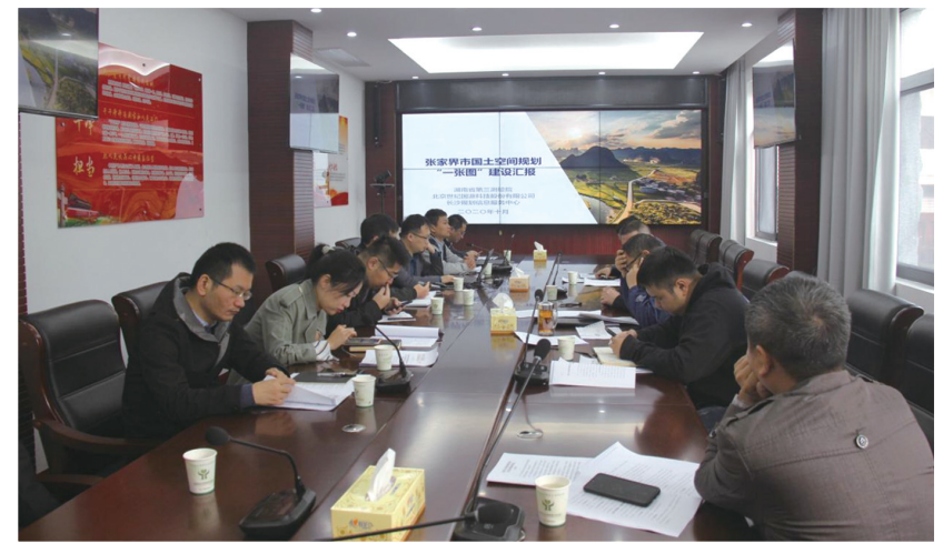
一张图建设以三调数据为依据，是构建国土空间规划体系的重要内容，是详细规划、相关专项规划编制、审批的基础和依据，为统一国土空间用途管制、实施建设项目用地许可、强化规划实施监督提供了依据和支撑。