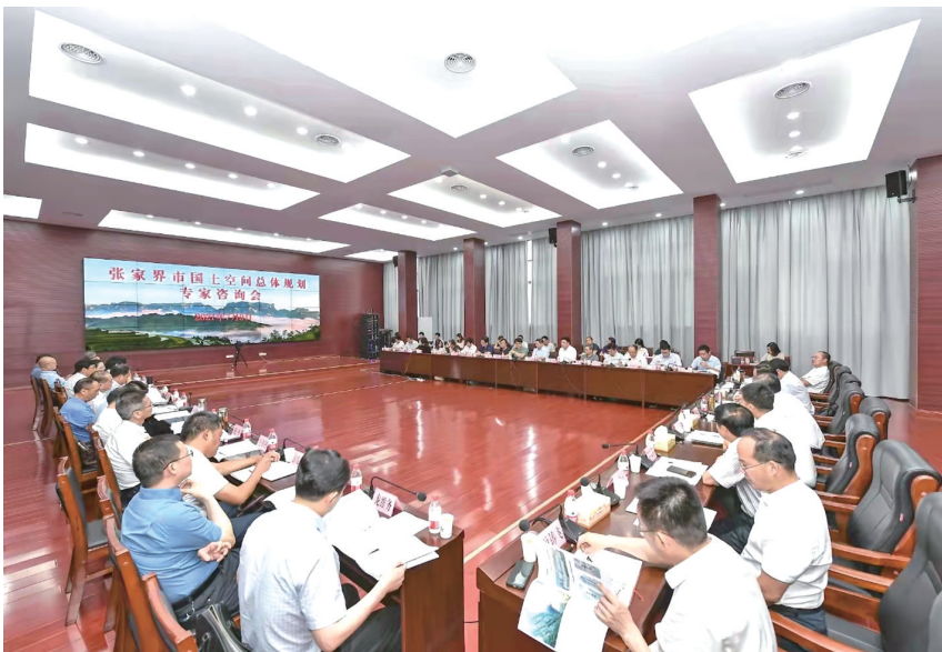
2021年7月9日，我市召开国土空间规划省级专家咨询会，邀请国内规划领域知名专家对市级国土空间规划进行咨询，与会专家对张家界的发展提出宝贵意见。

下一步，我市将加快完成构建三级三类国土空间规划体系，强化统筹协调，科学划定三区三线，加强联动协作，推进专项规划和详细规划编制。前路漫漫，我们相信，在《规划》落地实施后，张家界必将在谱写新时代坚持和发展中国特色社会主义湖南新篇章中彰显张家界担当。