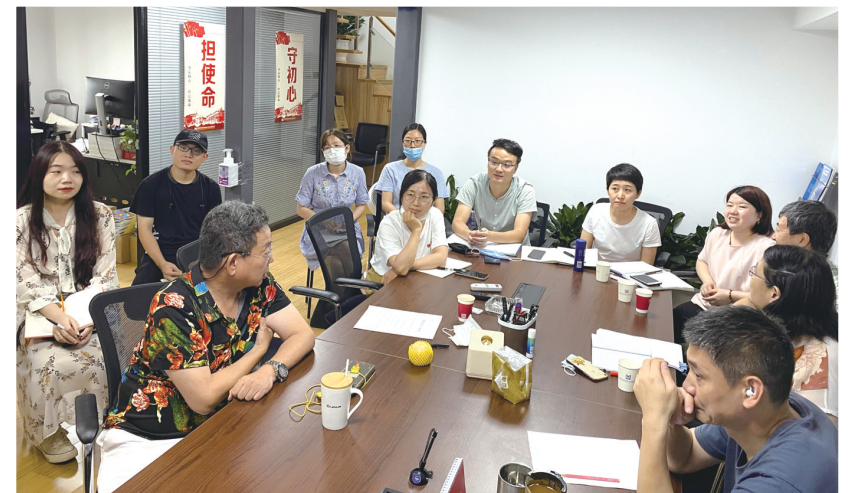
设计团队汇集各个行业技术人员，对规划中存在的问题、遇到的难点多次进行深入讨论，为规划编制提供重要的基础数据支撑。