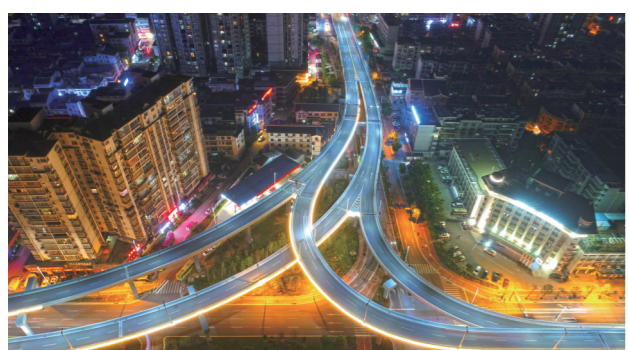
建成投入使用的张家界高架桥。