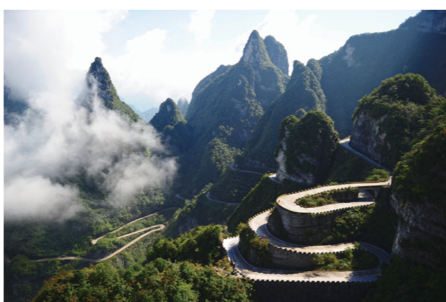
天门山99道弯盘山公路。