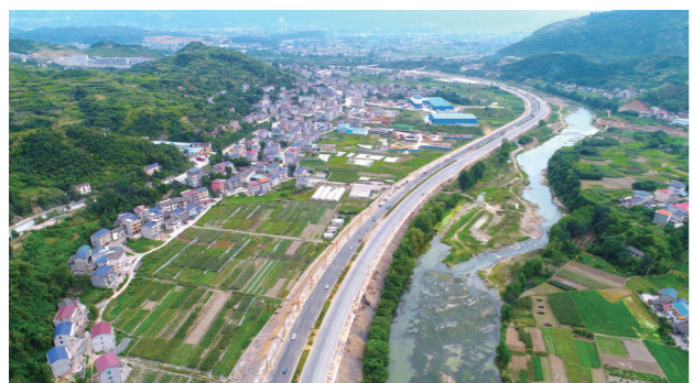
子午西路延伸段。