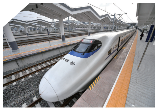
张家界高铁西站。

一条条道路、一个个成绩，见证着交通的变迁，诠释着时代的进步。眼下，张家界全面进入“高速”“高铁”“高飞”时代，基本构建起以高速公路为骨架，以G241、G353、S303、S306等国省干线公路为支撑，以县乡公路为脉络、村组公路为基础，航空、铁路并驾齐驱，内联外畅、相互衔接、层次分明的综合立体交通大格局，大交通铺就“黄金路”，张家界的交通变迁跑出加速度！