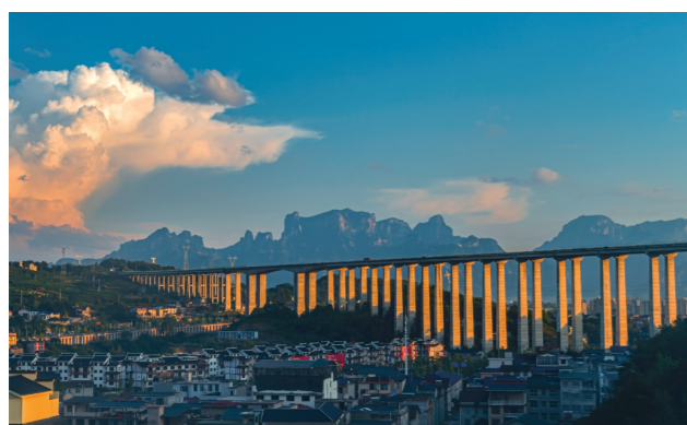
张花高速。

要想富，先修路。曾几何时，这样的标语深入人心，饱含着人们对修路致富的美好生活向往。希望，由路而生。在一个重点建设项目的支撑下，张家界的公路建设发生了