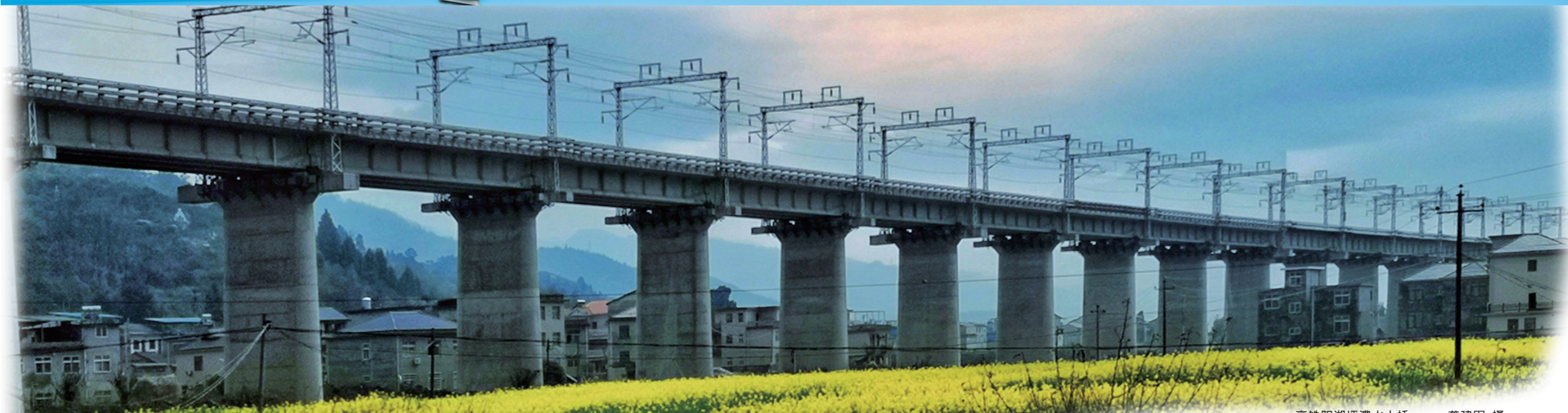
高铁阳湖坪澧水大桥。