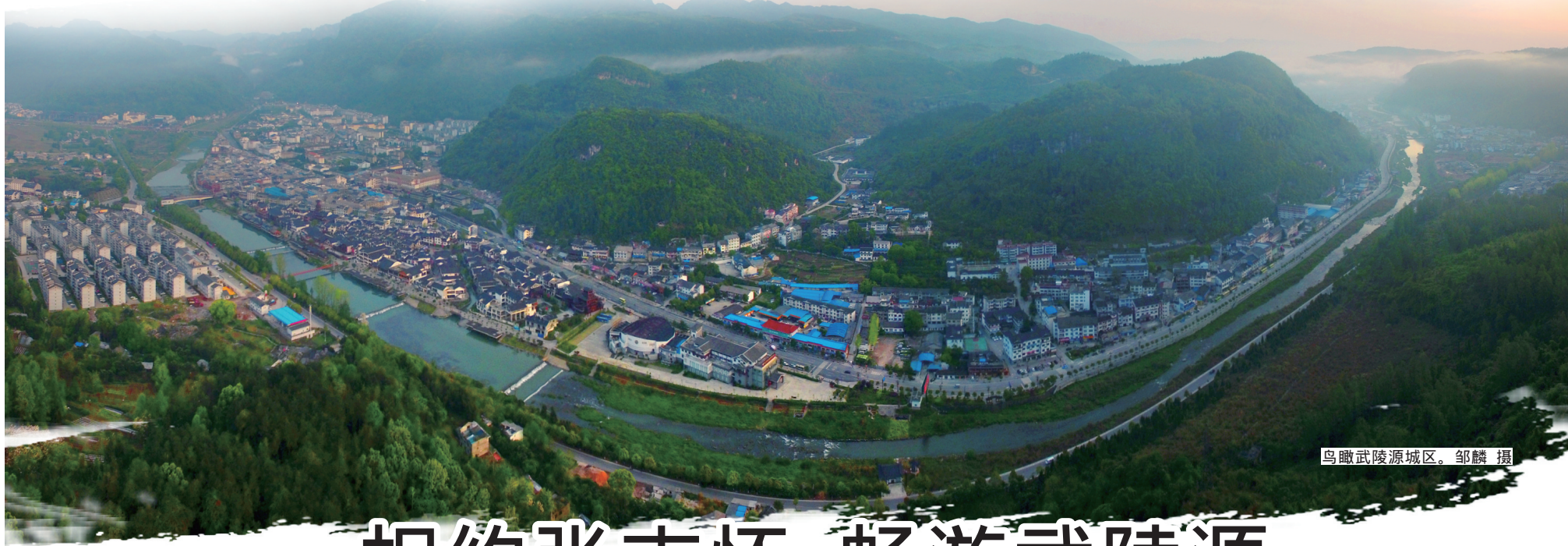
鸟瞰武陵源城区。