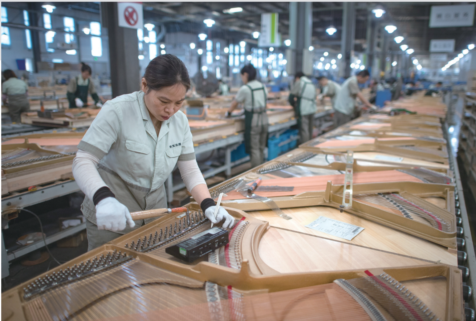
11月23日，工人在柏斯音乐集团宜昌钢琴生产基地进行钢琴部件安装。