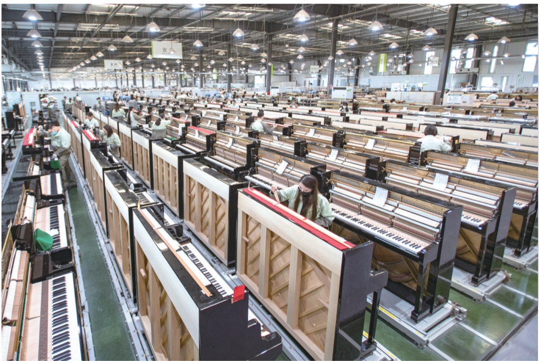
11月23日，工人在柏斯音乐集团宜昌钢琴生产基地调试钢琴。