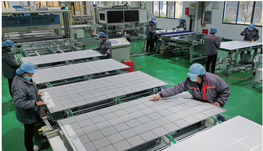
▲11月20日，白河县双丰镇村民就近在一家科技有限公司务工。当地政府出台系列金融扶持政策，鼓励返乡人员创办企业，从而解决了大批村民在家门口就业增收。