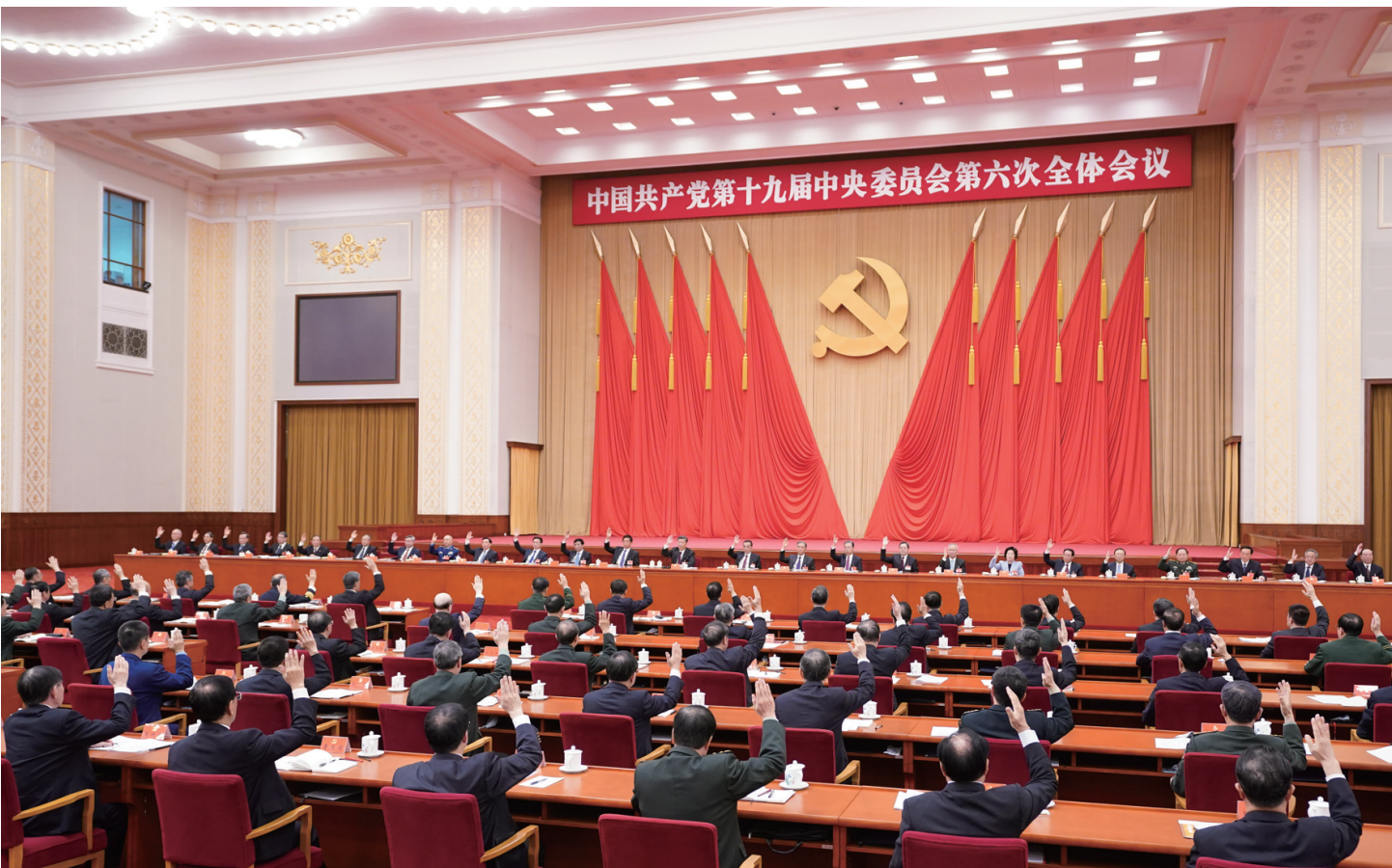
中国共产党第十九届中央委员会第六次全体会议，于2021年11月8日至11日在北京举行。中央政治局主持会议。