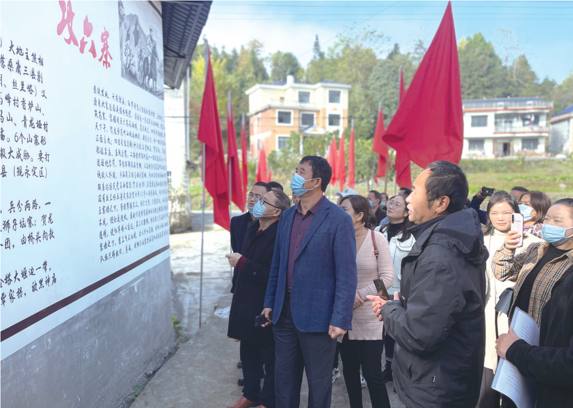
11月10日，张家界敦道小学党总支组织全体党员来到贺龙驻杨家湾革命活动旧址，开展 白马上山，党旗飘扬 主题党日活动。