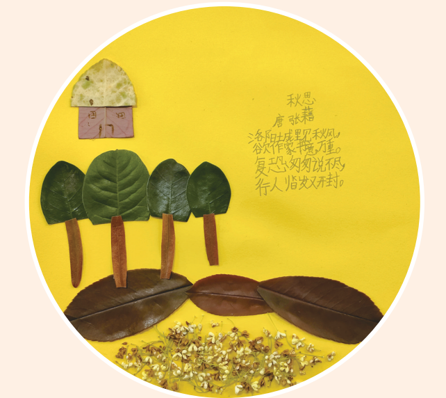
《秋思》 黄诺凡 作