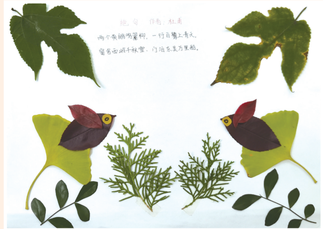
《绝句》 伍浩宇 作