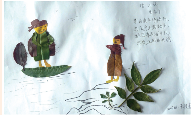
《赠汪伦》 李俊豪 作