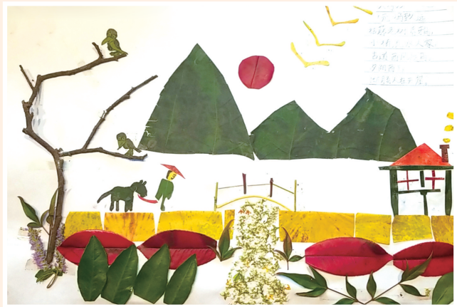
《天净沙 秋思》 熊境琪 作