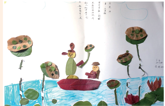
《采莲曲》 李梓琳 作