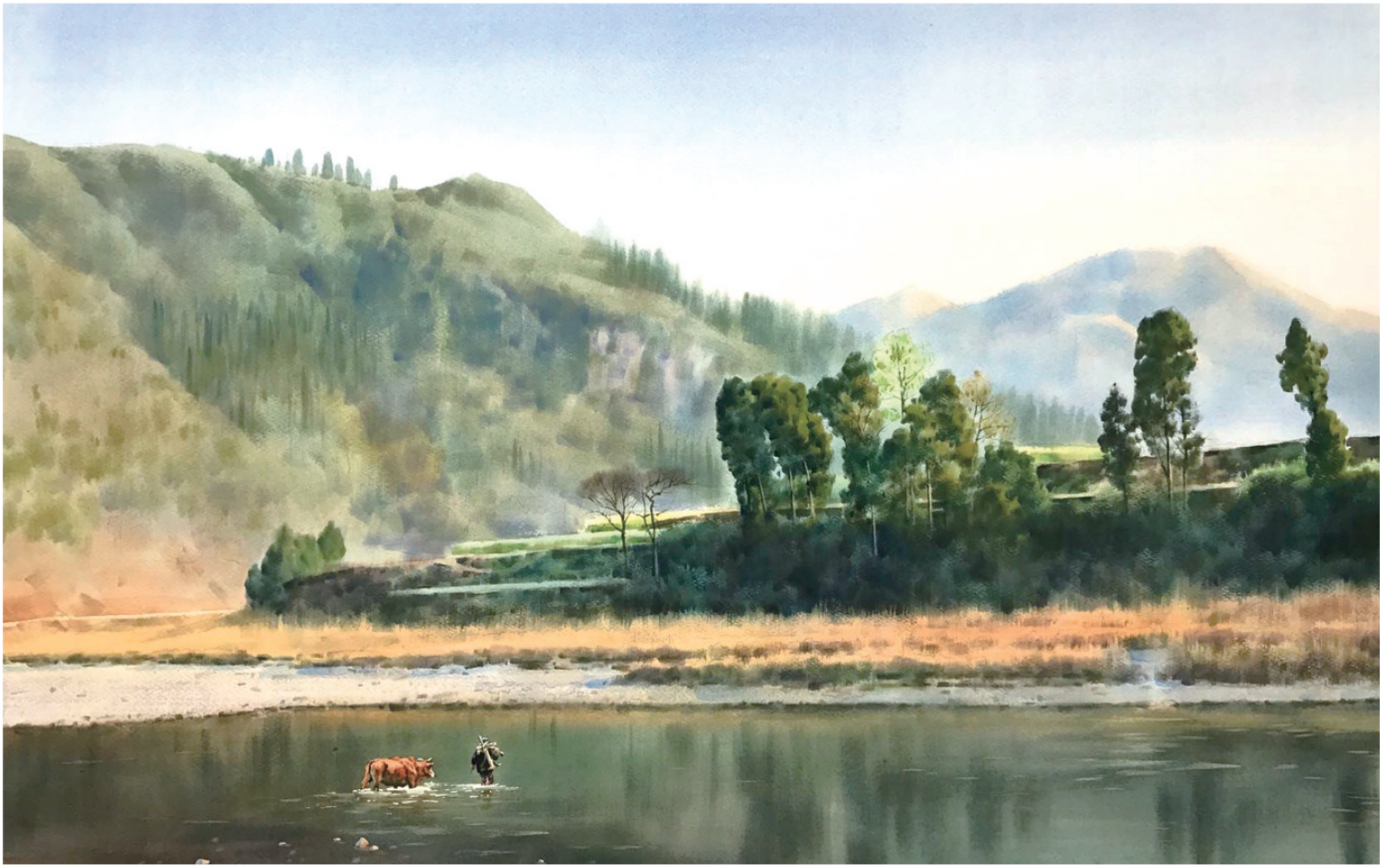
《九渡溪的秋》 水彩画 55cm 75cm

唐植欣老师的画，立足于乡土家园，以家乡的青山绿水为母体，由对景写生到对景创作，表现出带有特定区域特征的富于浓郁生活气息的乡野图卷。《九渡溪的秋》图中，秋水共长天的淡蓝色，落霞映芭茅的金黄色，冷暖色调如此交融，浓淡相宜。画面既呈现了开阔绵延的乡村视野，也体现了天高云淡的秋季细节。荷犁牵牛的农人涉水而过，让九渡溪灵活了起来，也让静止的画面生动了起来。这种在普通乡村推开木门就可以看到的寻常景致，表现的是一方水土，是家山真境，给人以