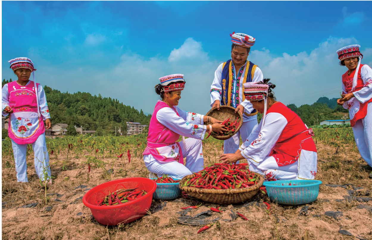
白族儿女在禾佳生态园采摘辣椒。

色社会主义思想为总引领，把贯彻落实好党的民族政策、做好民族团结工作、促进辖区民族团结进步作为街道的一项重要工作，牢牢把握 坚持共同团结奋斗，共同繁荣发展 的民族工作主题，健全机制，凝聚合力，创新手段，强化宣传在辖区形成了团结稳定、平等互助、和睦相处、共同发展的良好局面。今年，刘家坪白族乡被评为 湖南省民族团结进步创建示范乡镇。